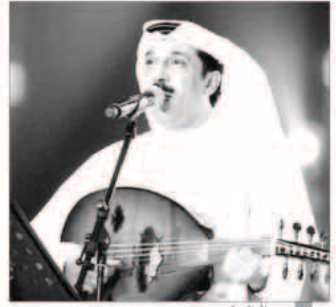
عبد الله الرويشد

ومحمد عساف، وقبل ختام المهرجان في الثلاثين من الشهر نفسه يكون موعد الجمهور مع «القبصر» كاظم الساهر والنجم الإماراتي حسين الجسمي. هذا وتبقي في المهرجان ليلة عاشره لم يتم الإعلان عنها بعد تواتر الأنباء عن اعتذار الفنان راشد الماجد، حيث تردّد في لجنة التنظيم أن الليلة الأخيرة سيعلن لها لاحقاً.