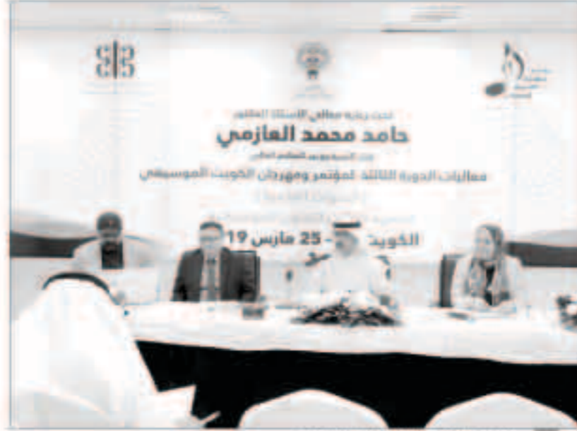
جانب من إحدى الندوات العلمية الموسيقية