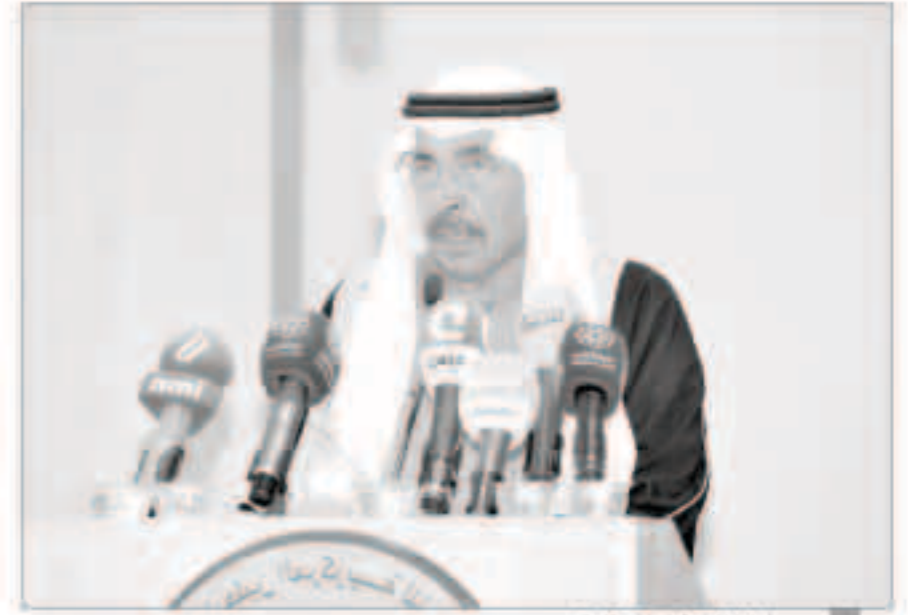
عبدالعزیز الباطین يلقي كلمته

الندوات النقاشية أو غيرها لافتاً إلى أن الأمانة الشعرية الثانية ستخصص للشعراء الشباب وذلك تشجيعاً لهم وتحفيزاً للمواهب واحتضاناً لكل أبداع. وذكر أن المؤسسة أطلقت في هذا المهرجان 11 إصداراً متنوعاً في الشعر ودراساته وهي متاحة للجميع للحصول على ما يرغبون منها.