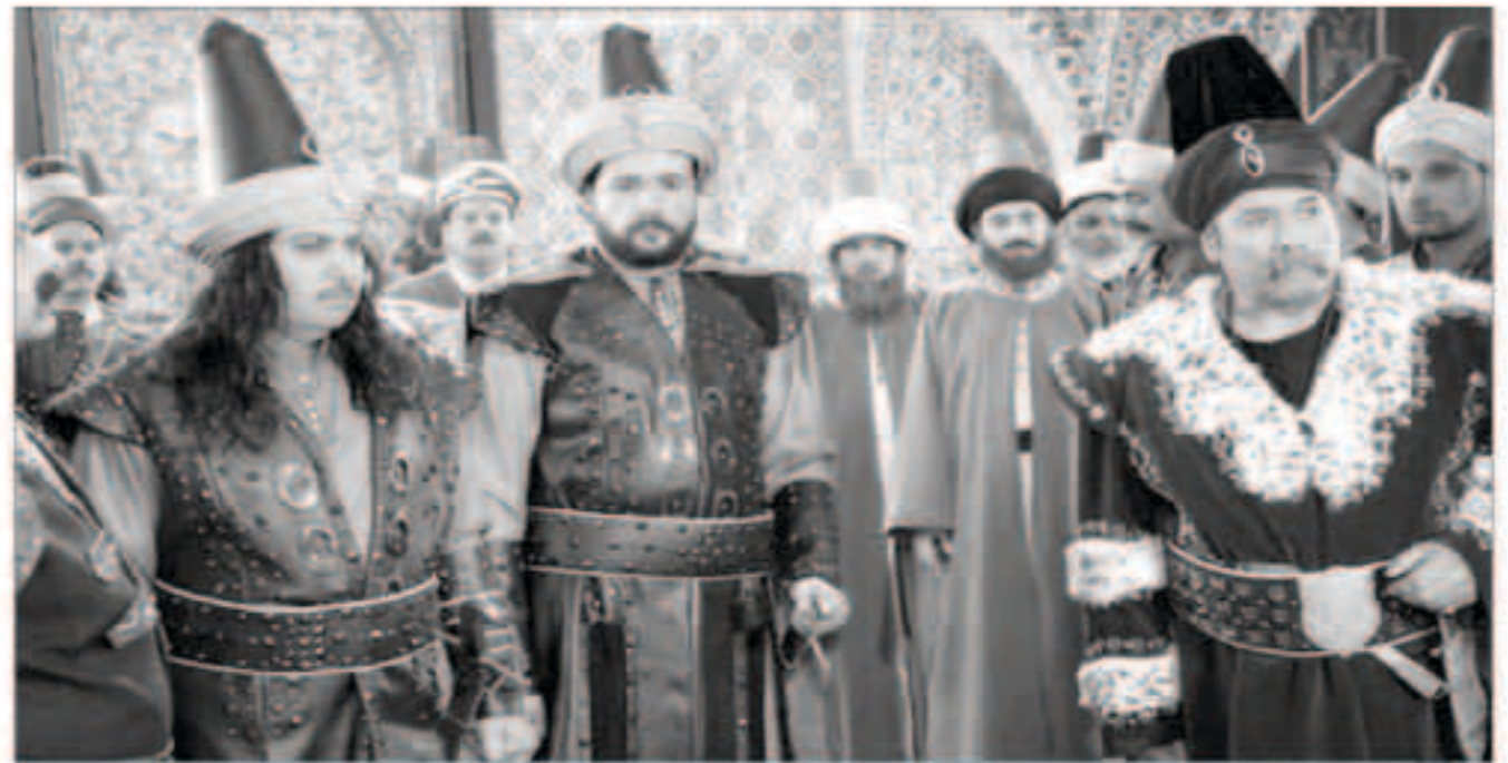
مشهد من مسلسل «السلطان والشاه»

تم اعتماد على مصادر تاريخية مهمة من مختلف الجهات الفارسية والتركية والعربية للتحقق من الوقائع واستبصار دلائلها «كي تسير في ظل التاريخ وتوظفه دراسيا بطريقة شيقة تحاكي المعلومات الموثقة لإمتاع المشاهدين». ويتوقع العلي أن العمل سيكون من بين أهم الأعمال العربية خلال الدورة الرمضانية المقبلة، لما يحمله من ضخامة الإنتاج وأهمية الموضوع وحشد النجوم العرب الذين عملوا فيه.