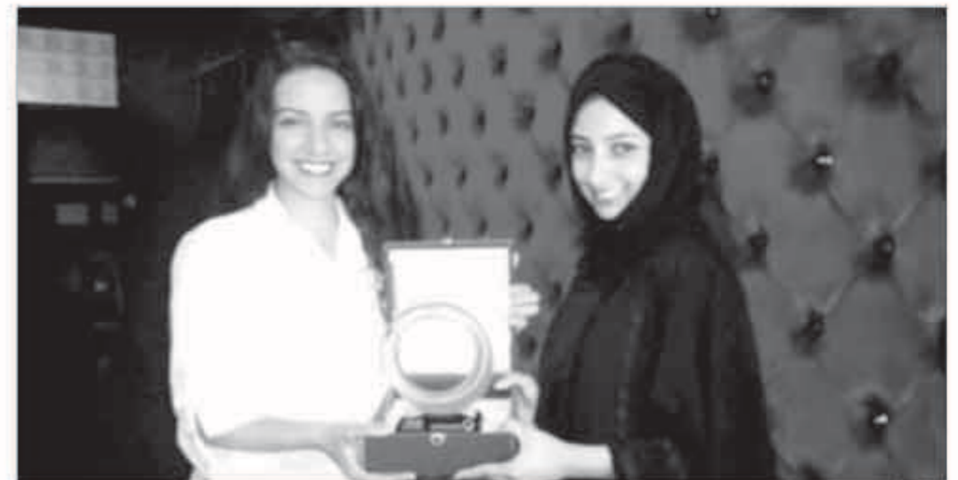
ليلي كنعان تتسلم درع التكريم

عبرت المخرجة اللبنانية ليلي كنعان عن سعادتها واعتزازها بالتكريم من قبل حكومة دبي، وحصولها على درع تكريمي، تقديراً لإبداعها وجهودها التي ترجمت في حملة التوعية الدعائية، والتي صورتها وأخرجتها ليلي في إمارة دبي لصالح وزارة الطاقة والمياه الإماراتية، ووجهت كنعان الشكر إلى حكومة دبي، وقالت إنها تتعامل لأول مرة مع جهة حكومية إماراتية، مضيفة أن