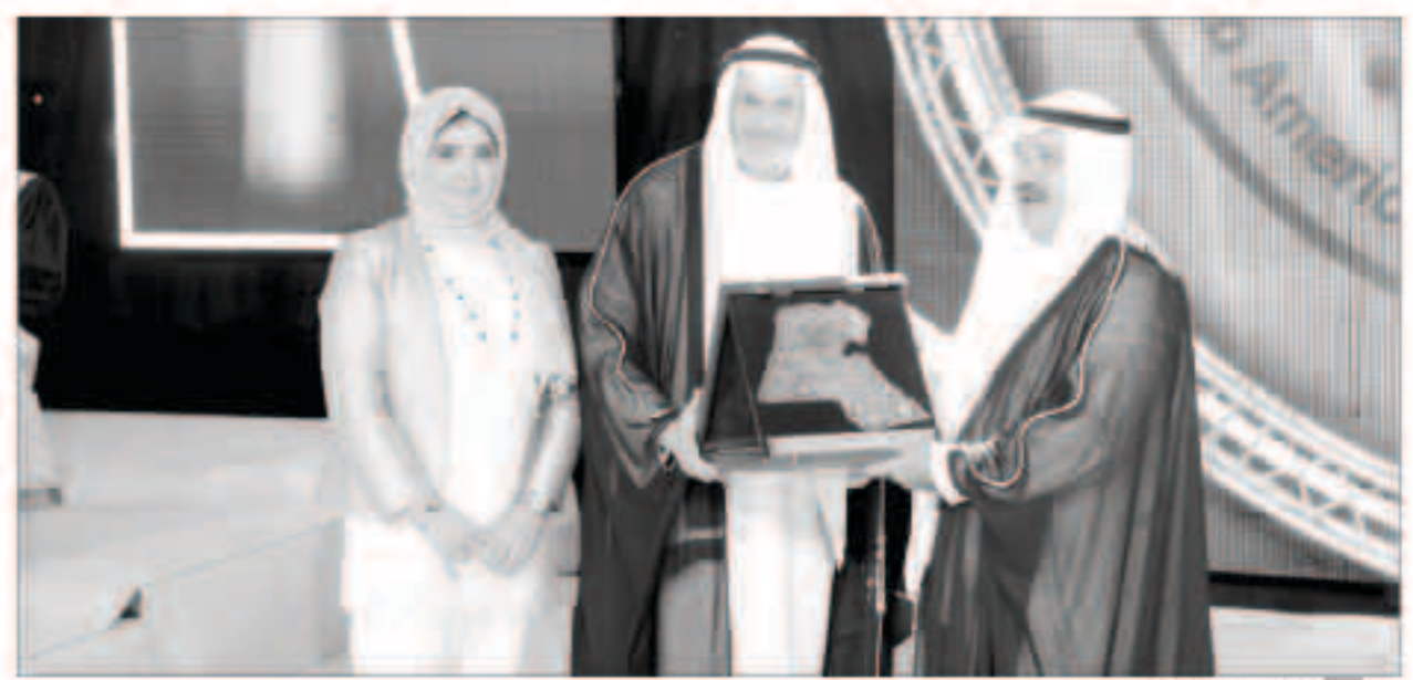
تكريم الشيخ ناصر