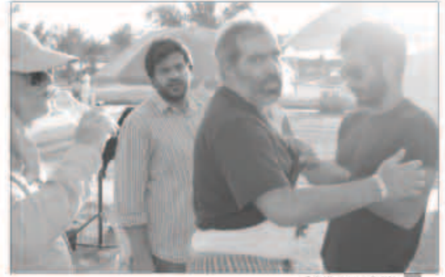
أثناء تصوير بعد النهاية