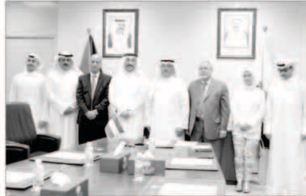
وزارة التجارة والصناعة الكويتية واتحاد مصارف الكويت خلال توقيع مذكرة تفاهم لنقل المعلومات

التي تنظم العلاقة بين الجهتين وتضمن السرية المصرفية. وأشار إلى أن «التجارة» انتقلت خلال الفترة السابقة إلى إعادة تأهيل خدماتها المقدمة وفقاً للقانون علاوة على تحقيق المصلحة التي تعود على المراجعين والمتفاعلين من تلك الخدمات.