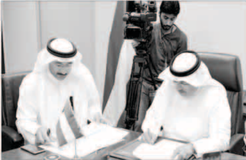
جانب من توقيع مذكرة تفاهم لنقل المعلومات بين وزارة التجارة والصناعة الكويتية واتحاد مصارف الكويت

■ «المصارف» احتضن هذا المشروع ووفر لـ «التجارة» جميع الإمكانيات والدعم