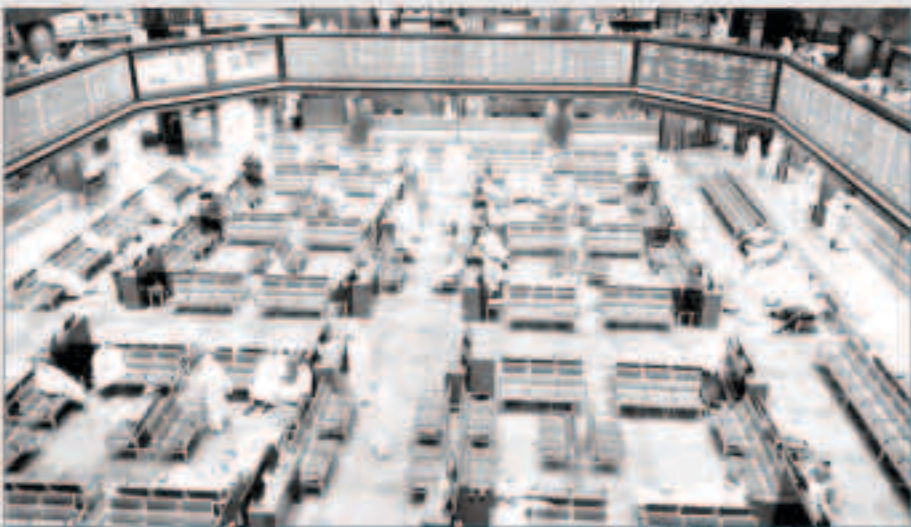
البورصة أنهت تعاملاتها حمراء

انخفاضات ضمن 116 شركة تمت المناجزة بها، وبالنظر إلى إجمالي حركة مكونات مؤشر أسهم (كوبت 15) نجد أنها استحوذت على 5,5 مليون سهم بقيمة نقدية فاقت 2,9 مليون دينار. وتمت عبر 309 صفقات نقدية وبخروج المؤشر من تعاملات الجلسة عند مستوى 801,8 نقطة. وكان لأخبار العديد من الشركات أثر واضح في اتخاذ قرارات المعاملين في الدخول بأوامر الشراء أو البيع جراء هذه التطورات منها التطورات في شأن شركة الكويتية للمصالح حول الانسحاب الإخباري من بورصة الكويت حيث كان مجلس إدارة الشركة أوصى في الرابع من أغسطس الجاري بالانسحاب من السوق الكويتي. إلى ذلك انشغل بعض المعاملين بالإفصاح عن موافقة بنك الكويت المركزي على طلب بنك بقران السماح بشراء أو بيع ما لا يتجاوز شراء الـ 10 في المئة من أسهمه وكذلك إتمام عملية بيع لشخص مطلع على أسهم بيت التمويل الكويتي (بيتك) والإفصاح من شركة (فجيرة) بشأن التداول غير الاعتيادي. يذكر أن المؤشر السعري لسوق الكويت للاوراق المالية (البورصة) انقل متخفصاً 1,75 نقطة ليبلغ مستوى 5419,6 نقطة ولحققت قيمة نقدية بلغت نحو 6,7 مليون دينار من خلال تداول 61,02 مليون سهم تمت عبر 1527 صفقة نقدية.