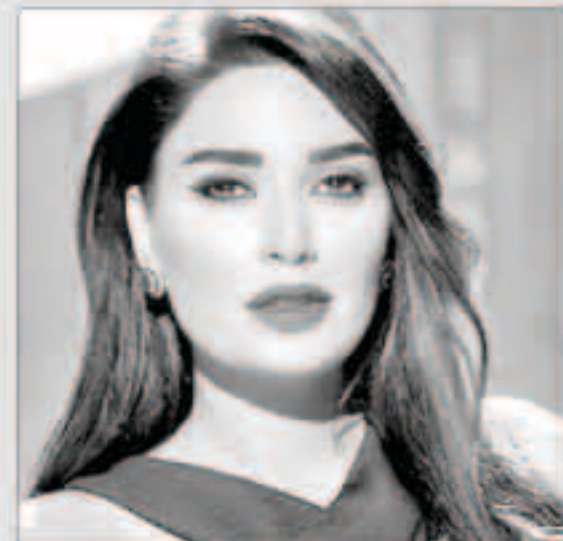
سيرين عبد النور

أعلنت الفنانة سيرين عبد النور عن إحيائها لحفل فني في فندق ميريت في قبرص، في 23 يونيو المقبل. ويبدو أن سيرين عبد النور قد أنهت من إجازة الولادة والأمومة، ويعد هذا الحفل الفني هو الأول لها بعد ولادة طفلها الثاني كريستيانو. ولم تكشف سيرين عبد النور عن مشاريعها الفنية الأخرى، خصوصاً التمثيلية منها، بعد أن كانت قد قدمت آخر أعمالها الفنية، من خلال خماسية بعنوان "الشهر السابع" التي تقاسمت بطولتها مع روبريغ سليمان وميرفا القاضي، وهي من كتابة رافي وهيب وإخراج فليبي أسمر. أشار إلى أن محطة "الجديد" أرجحت عرض هذه الخماسية إلى ما بعد الموسم الرمضاني 2018.