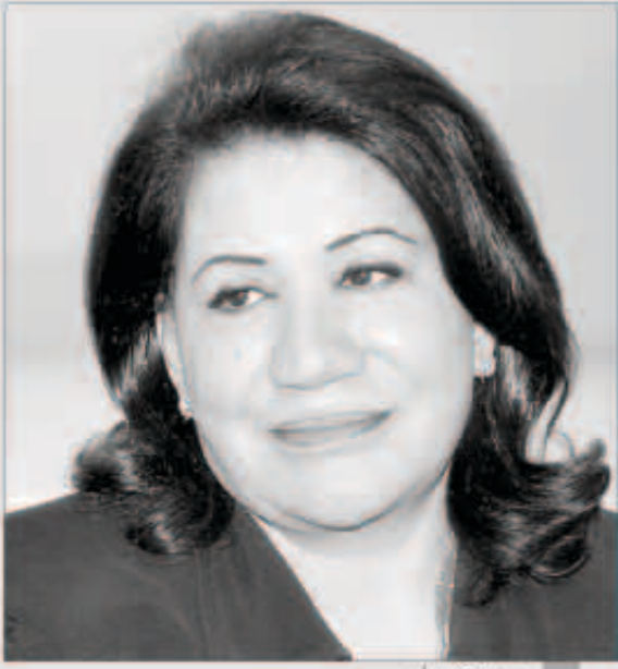
سعاد عبد الله

يبدو أنّ الفنانة القديرة سعاد عبد الله لن تنتظر حتى قدوم شهر رمضان المقبل، لتقديم جديدها. خلال الأيام المقبلة، ستقف مجدداً أمام الكاميرا لتصوير مسلسلها الجديد «الواجهة». ومن المتوقع أن يبدأ عرض المسلسل مباشرة بعد الانتهاء من تصويره، علماً أنه من تأليف الممثلة القديرة أسهان توفيق. ومن المتوقع أن يشارك فيه جاسم النبهان وعبد الرحمن العفل إلى جانب عدد من النجوم والنجمات في عالم التمثيل الخليجي. يذكر أنّ سعاد عبد الله اطلقت في رمضان الماضي بمسلسلها «البيت بيت ابونا» إلى جانب الممثلة القديرة حياة الفهد.