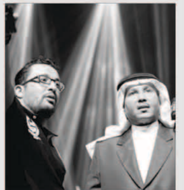
محمد عبده مع المخرج يعقوب المهنا

رغم الهجوم الكبير الذي تعرض له الفنان محمد عبده بعد ظهوره بصورة لم يعتدها جمهوره في كليب أغنية «وحدة بوحدة»، إلا أن الأخير حقق نجاحاً كبيراً على قنوات «روتانا»، خصوصاً «روتانا موسيقى». إذ احتلت الأغنية أسس المركز الثاني بين الأغاني الخليجية والعربية الجديدة، وتعد الأكثر طلباً في القناة، ووردت ضمن برنامج TOP 40. وحمل الكليب توقيع المخرج الكويتي الشاب يعقوب المهنا الذي اصدر مكتبته الإعلامي أخيراً بياناً صحافياً كذب التقارير الإعلامية التي تحدثت عن خلاف بينه وبين «فنان العرب» بسبب الكليب. وجاء في البيان: «ينفي المخرج الكويتي يعقوب المهنا تصريحه لأي وسيلة إعلامية في الخليج أو الوطن العربي بخصوص كليب فنان العرب محمد عبده «وحدة بوحدة»، ويؤكد أنه لم يدل بأي حديث لأي طرف. كما يؤكد أن لا خلاف مع فنان العرب، بل إن علاقته معه طيبة وفي أحسن حال».