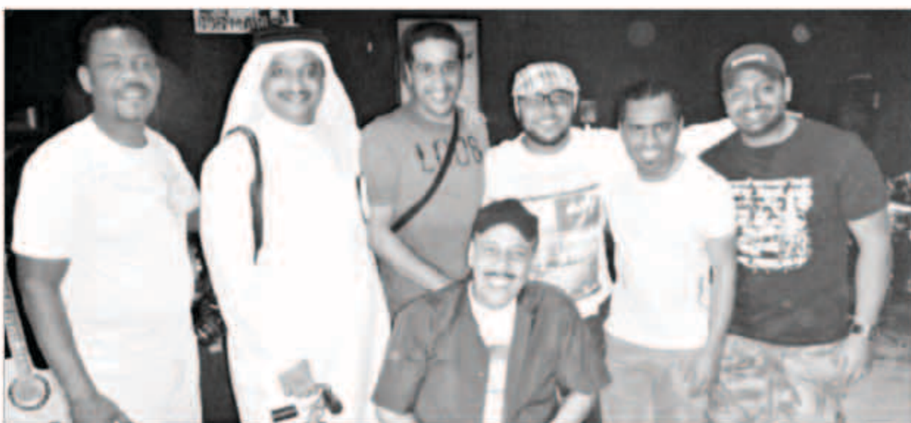
فرقة الإخوة البحرينية

وعن جديده كشف القائد «ارتبطت في الفترة الأخيرة في عدة أعمال موسيقية لإذاعة والتلفزيون للدورة الجديدة، وهناك فيلم تسجيلي وثائقي أعمل على وضع الموسيقى التصويرية وهو خاص لقناة الجزيرة، وعن الأعمال الخاصة سوف نبدأ في التجديد والمواصلة في تطوير الأغاني الكارثون وقريباً سوف نطرح تجديد أغنية لعزل كارثوني مميز، بالإضافة لمشروع جديد في استوديو كانوا الأذاعي لتوزيع الفنون الشعبية البحرينية».