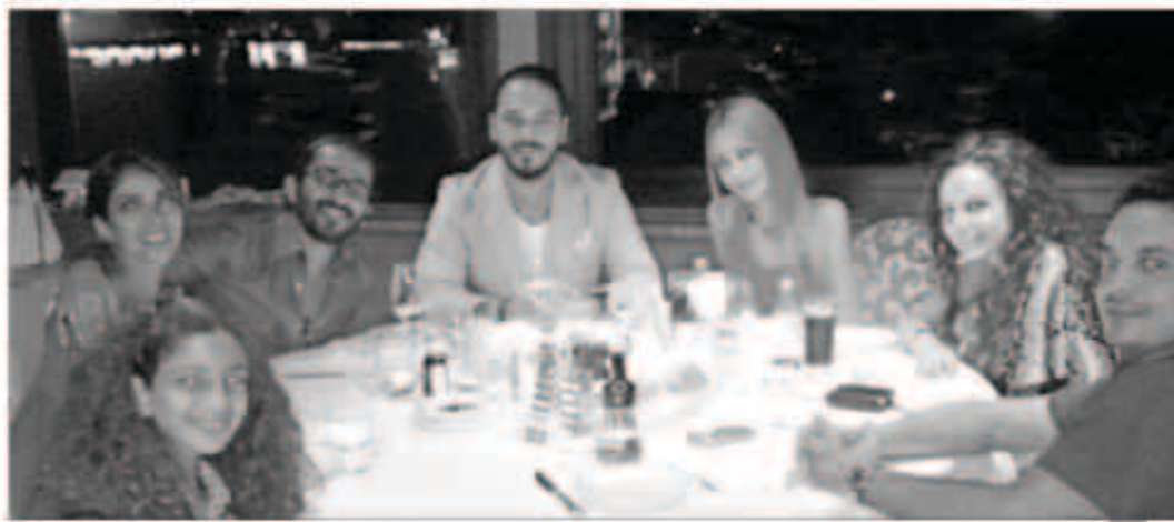
رامي عياش وزوجته مع أحمد حلمي وزوجته

بعد أن دخل القصر الذهبي أخيراً بزفافه المميز، أعلن الوب ستار رامي عياش أنه يتمتع مع زوجته «داليدا» بشهر العسل في إيطاليا. وشارك رامي وجوده هناك الممثل المصري أحمد حلمي وزوجته الممثلة منى زكي. ورحب رامي بوجوده معهما ناشراً صوراً تجمعهم وقال: «مع زوجتي النجمة منى زكي واحلى يومين في إيطاليا سوا».