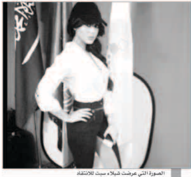
الصورة التي عرضت شيلاء سبت للإنتقاد

باسلوب شديد اللهجة وغير معتاد من الفنانة ومملكة الجمال البحرينية شيلاء سبت، ردت على منتقديها ممن سخروا من اطلاقها الأخيرة بعد الصور التي نشرت على صفحتها بتويتر. شيلاء نشرت صورتها وهي ترتدي قميص ابيض ضيق وبنطلون ضيق جداً، وخلفها علم السعودية مما وضعها في موقف شديد الحرج امام الجمهور.