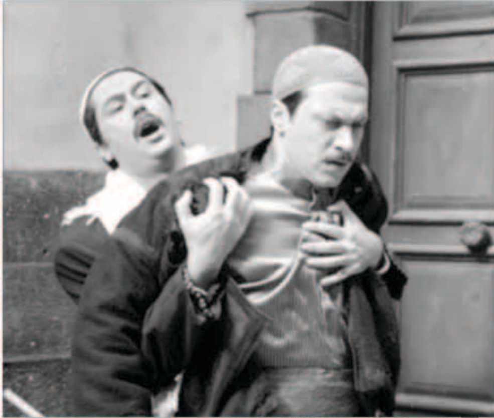
الموسم الرمضاني المقبل قد يشهد عودة السلسلة الشهيرة «باب الحارة»