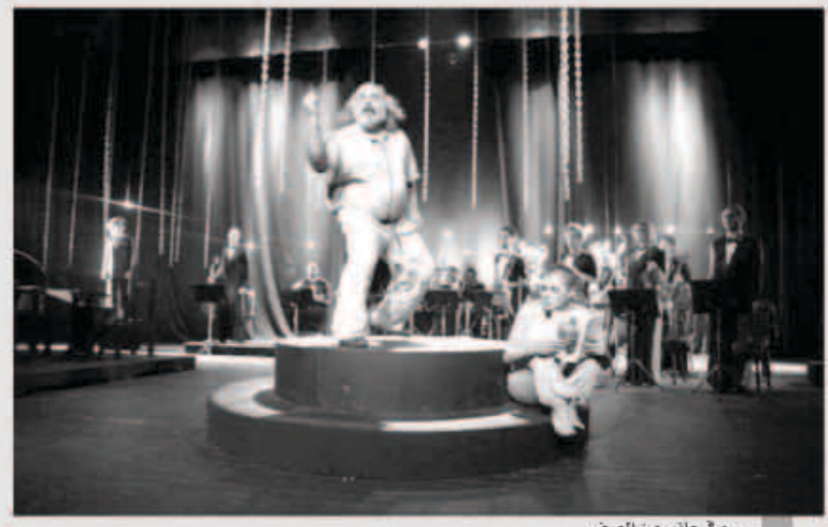
... وفي جانب من العرض

ولأن هذه القصة تتناسب الدور، أخذت ندى هذا القرار الصعب واليوم تقول: «كنت مرتاحة لفكرة أن أكون أكثر تصالفاً مع الشكل الذي يتطلبه الفن. الحياة لا تنتهي هنا، حقاً أنا سعيدة، Fresh ومتخللة».