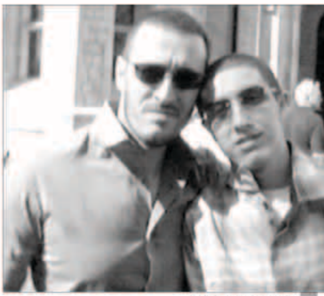
كاظم الساهر مع ابنه عمر

نفت مصادر مقربة من قيصر الغناء العربي كاظم الساهر الخبر الذي تداولته بعض المواقع الإلكترونية والفضائيات ومفاده وفاة عمر ابن كاظم الساهر أثناء زيارته لوالدته في منطقة الشارقة إثر تعرضه لحادث سير. هذا وأضافت المصادر أن القيصر تفاجأ من إنتشار الخبر وأكد أن ابنه جالس بجانبه وأن هذه الأخبار كلها لا تمت للحقيقة بصلة وتندرج ضمن نطاق الشائعات. وأضافت المصادر أن هناك بعض الإعلاميين الذين يبحثون عن الأخبار الساخنة والغريب الصحيحة دون التأكد من المصدر أو التحري عنه، مؤكداً أن القيصر يتأسف عن ترويج الإعلام لمثل هذه الشائعات الغير الدقيقة.