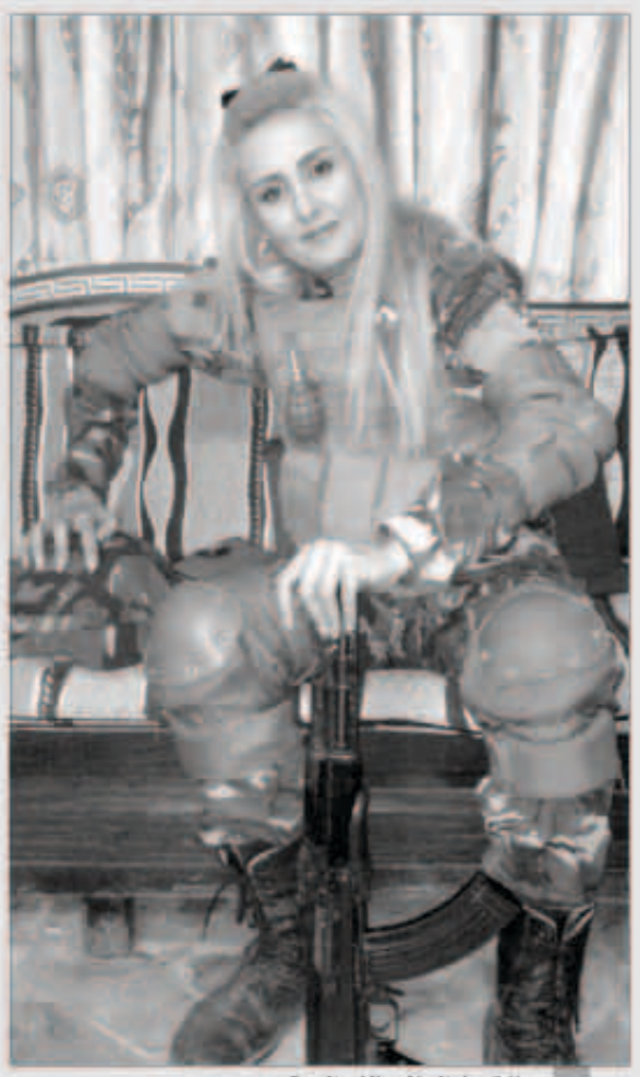
رنا تحمل السلاح بالزي العسكري

أثارت الإعلامية السورية رنا داغر، حالة من الجدل على مواقع التواصل الاجتماعي بعد نشرها صوراً لها وهي ترتدي الزي العسكري و منجدة بالسلاح.