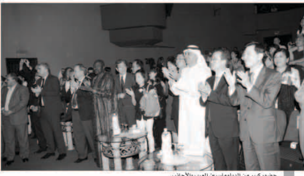
حضور كبير من الدبلوماسيين العرب والأجانب

ويتضمن نشاط القافلة اقامة عروض فنية خلال الجولة في الإمارات المتحدة والجزائر. وتامرس القافلة نشاطها في المنطقة العربية منذ 2008 لتعزيز التعاون والتفاهم والتواصل بين كوريا والعالم العربي. بالإضافة الى مجموعة من الأنشطة الثقافية الأخرى التي تصب في اتجاه تعزيز التعاون وذلك من خلال الجمعية الكورية العربية التي تأسست في العام نفسه.