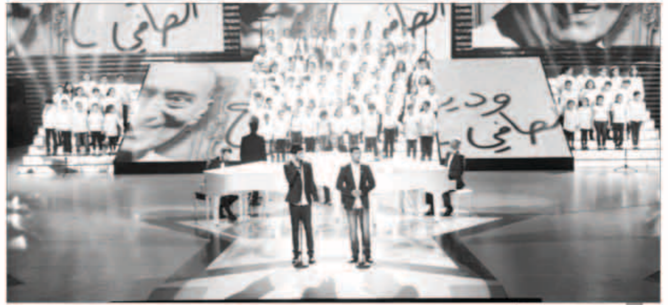
تكرم العملاق وديع الصافي

الزومينيز الثلاث أدوا أغنان منفردة، فقدم طاهر أغنية «وياه»، ثم نور أغنية «جرح الماضي»، وعيسى أغنية «بحبك وحشتيني». كما أطل اللاتالي الطربي النسائي ليليا، ميساء وزينب بأغنيات «زي العسل»، «بحلم بلك»، و«احضن الأيام». في التوب 5 لهذا الأسبوع، دخلت ماريا للمرة الأولى محتلة المركز الخامس، يليها زكي في المرتبة الرابعة، ليرتاج عبدالله من المرتبة الأولى إلى المرتبة الثالثة، في ما تقدم مصعب إلى المرتبة الثانية، لتحل رنا المرتبة الأولى وتفوز بجائزة الخروج للاستجمام برفقة زميلتها سكيته.