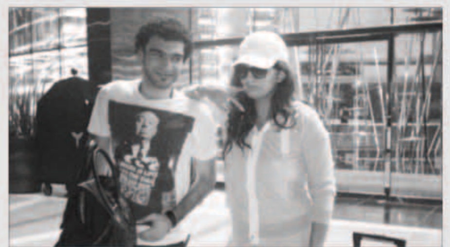
شذى إلى موقع التصوير