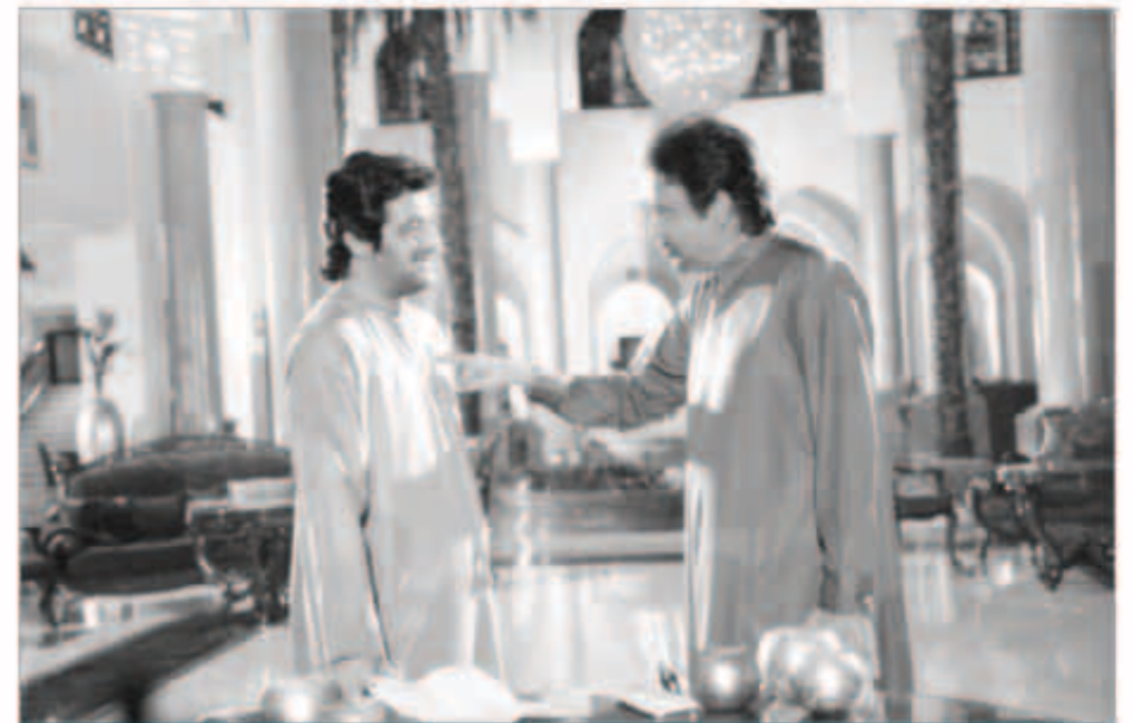
مشهد من الفيلم

في السابق الأوسي فيلم بعنوان عقاب المقتبس عن رواية الكونت دي مونت كريستو، بينما جاء فيلمه الثاني بعنوان الرمال العربية، مقدماً من خلالها مقاربة خاصة لرحلات ويلفريد ثيسنجر وعالم البدو في الصحراء العربية، ويتضح أن يتواجد المزيد من نوعية هذه الأفلام في صناعتنا، فقد استغرق تصوير الفيلم أكثر من عام واستعان بعدة أماكن ذو مناظر خلابة مستخدم أكبر التقنيات الإنتاجية والكاميرات الحديثة في صناعة هذا الفيلم، وحرصاً منه على نشر الفيلم الإماراتي فقد تم إضافة ترجمة باللغة الإنكليزية للفيلم حتى يتسنى للجمهور الأجنبي مشاهدة الفيلم.