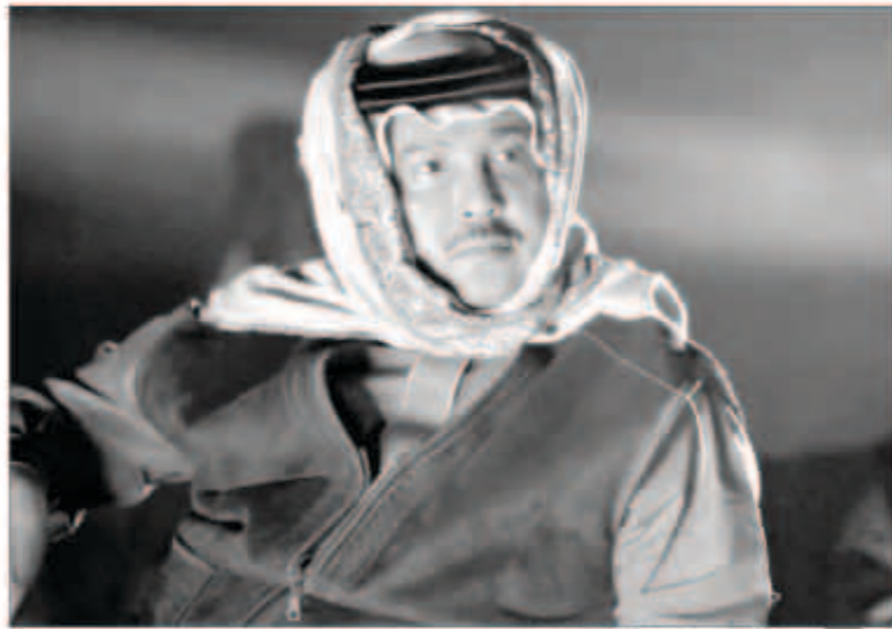
إطلاق جديدة ومختلفة لفنان العرب

خلال التصوير حرصه التام واهتمامه الكبير بالأعمال، مظهراً أخلاقاً ومهنية عالية في التعامل مع الجميع، وخاصة في عملية الأداء أمام الكاميرا، إنه إنسان رائع بفننه وبأخلاقه وفي كل شيء». وأضاف: «لقد عكس الفنان محمد عبده بروحه المرحة على عملية التصوير، حيث سيظهر ذلك أمام عين المشاهد الذي سينتاج أثناء مشاهدة الأعمال بأدائه المحترف أمام الكاميرا».