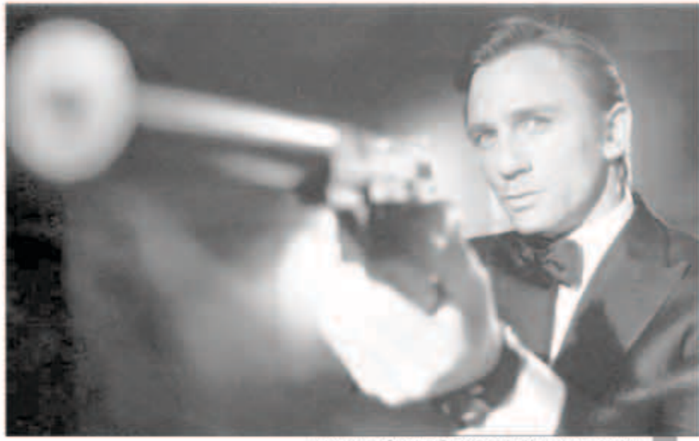
مزاد لشراء عدد من المقتنيات الخاصة بشخصية «جيمس بوند»

ينظم مهرجان دبي السينمائي، تحت رعاية الشيخ محمد بن راشد آل مكتوم نائب رئيس الدولة، رئيس مجلس الوزراء، حاكم دبي، والأميرة هيا بنت الحسين، سفيرة الأمم المتحدة للسلام، حفلاً خبيراً «ليلة واحدة تغير حياة الناس»، الذي يُقام للعام الثالث على التوالي. ويقام الحفل هذا العام بهدف دعم المتضررين من الأحداث السورية، وذلك عبر إقامة مزاد لشراء عدد من المقتنيات والمتعلقات الخاصة بشخصية «جيمس بوند» الشهيرة التي استخدمها في أشهر أفلام الجاسوسية، وأطولها مسيرة في تاريخ السينما، والتي تتضمن السيارة الخارقة طراز «أوستون مارتن فاكوش» الوحيدة التي تم إنتاجها احتفاءً بالذكرى الخمسين على انطلاق شخصية «جيمس بوند» في أفلام مثل «سكاي فال»، وتحمل شعار 007 وتكرى مرور 50 عاماً، كما تعرض في المزاد أيضاً تذاكر دخول حصري للعرض العالمي الأول لفيلم «جيمس بوند» المقبل، ومجموعة من ملابس شخصية «بوند»، وأدواته ومركباته التي تم استخدامها على مر العقود الماضية. ويدعم الحفل العائلات السورية المهجرة إلى لبنان في محافظة طرابلس، والأردن في محافظتي البلقاء والزرقاء، عبر تزويدهم بالمؤن الأساسية خلال فصل الشتاء، لمساعدتهم على تخطي تلك الفترة القاسية من العام، وستتضمن تلك المساعدات توفير المأوى، والغذاء، والمياه، والصرف الصحي، والمشآت الصحية، إضافة إلى ملابس شتوية، وباقات لتعليم الأطفال، حيث تُعتبر المساعدات ضرورية لإعانة المهجرين، من العائلات والأطفال القاطنين في مخيمات ويقام الحفل في فندق أرماني، ببرج خليفة، يوم الأربعاء 11 ديسمبر.