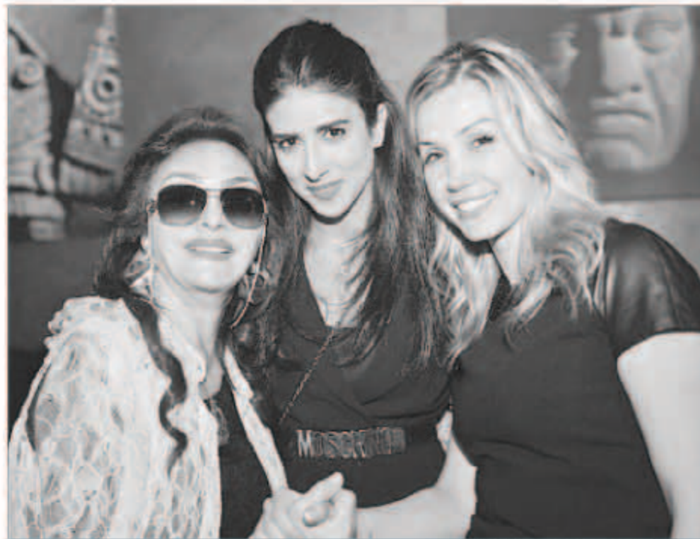
النجمة نبيلة عبيد خلال الحفل