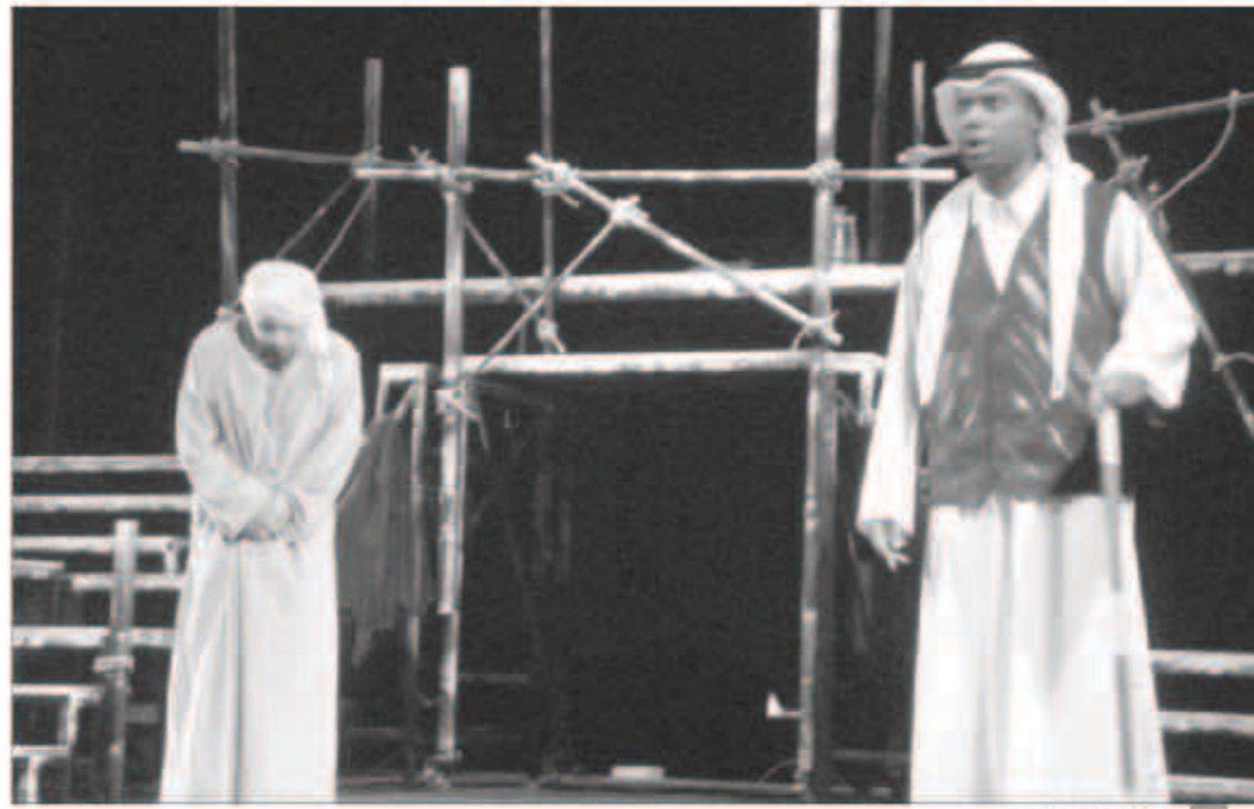
جانب من العرض

الثقافي والفكري بين شعوب الخليج العربية وشعوب المغرب العربي. وقد تناولت مسرحية «البوشية» للمؤلف اسماعيل عبدالله والمخرج عبد الله العابر قصة حب جمعت جواهر وهي فتاة من الطبقة الدنيا وغانم من عائلة ثرية علاقة قويت بالرفض من قبل حمود والد غانم. وكشفت هذه الواجهة من خلال لوحات المسرحية العميقة بعداً من أبعاد الصراع الطبقي الازلي ما بين طبقات المجتمعات الاستقرائية ليكتشف المشاهد من خلال اسم المسرحية «البوشية» وهي