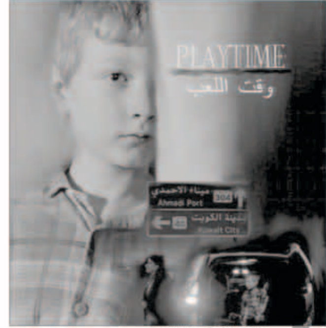
بوستر الفيلم الكويتي «وقت اللعب»