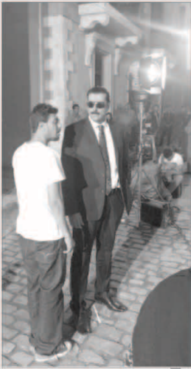
باسم ياخور في كواليس التصوير

تواجه الفنان السوري، باسم ياخور، خلال الفترة الماضية في العاصمة المصرية القاهرة، لتصوير مسلسل «المرافعة» الذي كتبه تامر عبد المنعم وبخرجه حازم فودة، وتنتجها مدينة الإنتاج الإعلامي وشركة ماركينز.