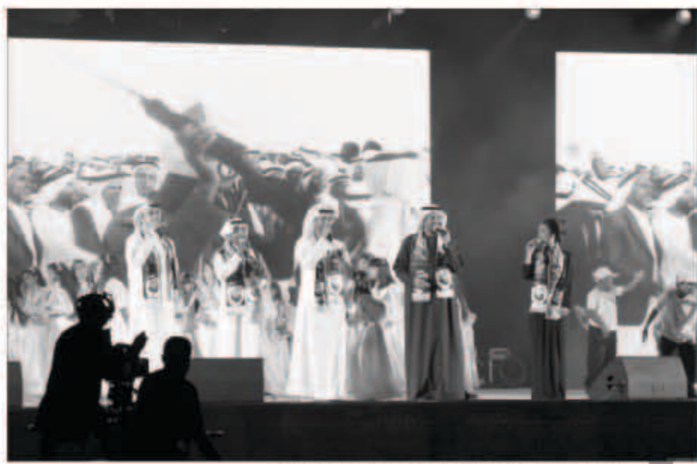
ويشارك الفنانين الغناء في أوبريت قصة علم.. حلم وطن، بالشارقة