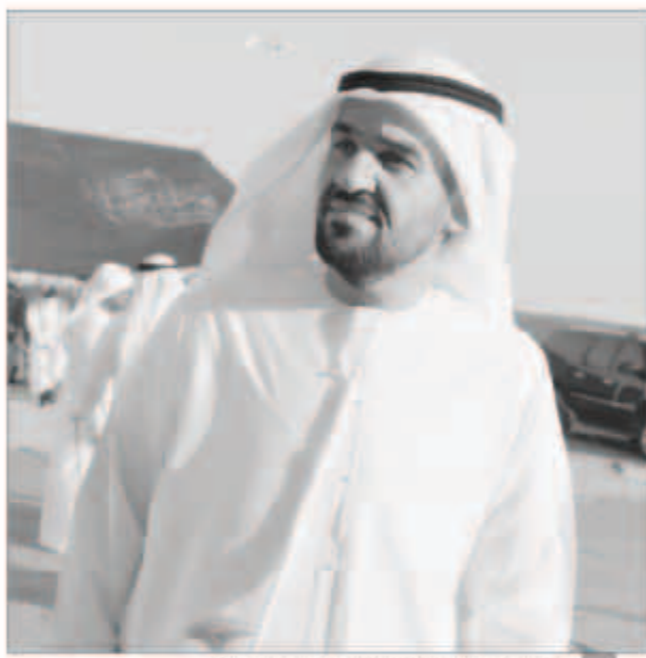
الجسمي خلال مشاركته في مهرجان زايد للتراث