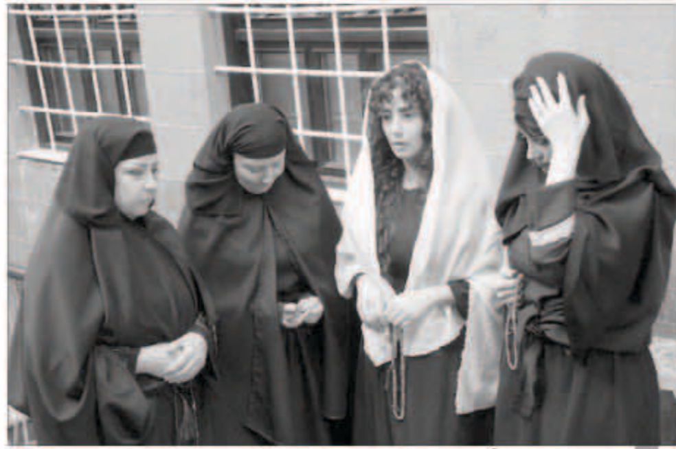
مشهد من طاحون الشر 2

يشارك في العمل نخبة من الفنانين من بينهم أمل عرفة، فايز قزق، جهاد سعد، نادين تحسين بيك وسامر اسماعيل. وكان النجم السوري جهاد سعد انتهى مشاهدته في المسلسل السوري «نساء من هذا الزمن» للمخرج أحمد إبراهيم أحمد، ومن تأليف الإعلامية بثينة