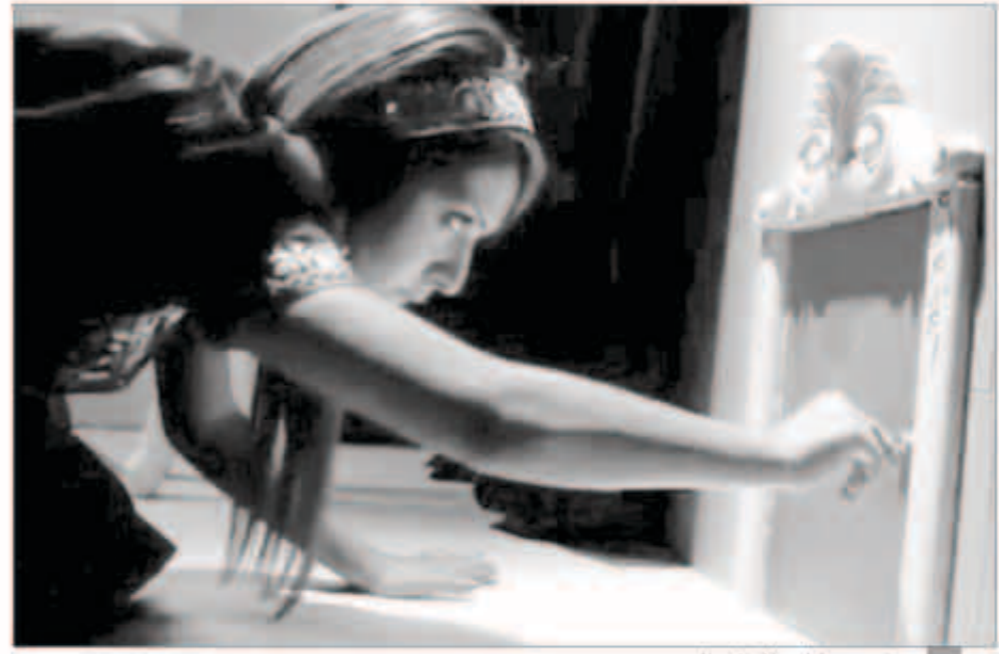
مشهد من فيلم «بلاد العجائب»