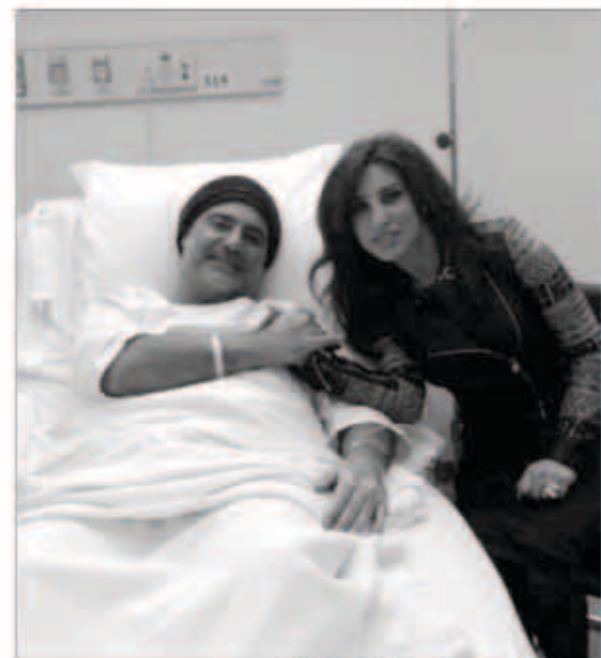
نجوى مع عاصي الحلاني بالمستشفى

زارت النجمة اللبنانية نجوى كرم مواطنها الفنان عاصي الحلاني للاطمئنان على صحته. عقب خضوعه لعملية جراحية مؤخرا. شمس الأغنية اللبنانية حرصت على طمأنة محبي فارس الأغنية العربية في العالم العربي، حيث التقطت صورة برفقه. وقد بدأ مبيتها بصحة جيدة، عقب إجرائه عملية لإزالة تكلس في ساقه. من ناحية أخرى، تستعد نجوى كرم لإطلاق أغنية منفردة جديدة. ومن المقرر أن تصورها على طريقة الفيديو كليب.