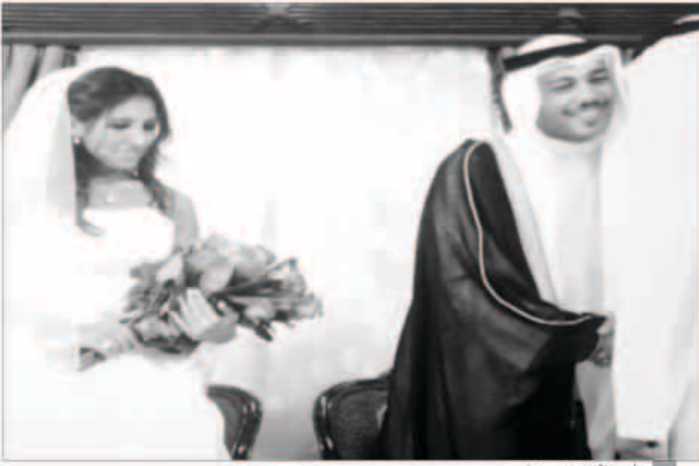
أحد الأبطال المعروضة