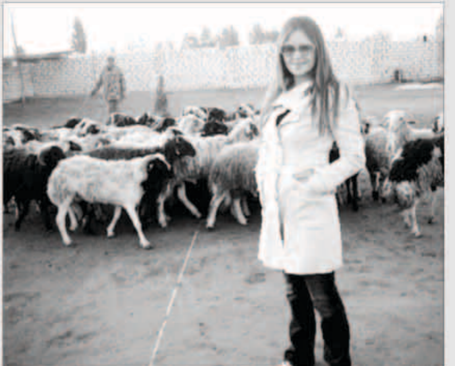
كارول سماحة وسط الحراف

مازالت النجمة اللبنانية كارول سماحة تشارك محبيها في فتحها بالإقامة في مصر. بعد زواجها من رجل الأعمال المصري وليد مصطفى، حيث نشرت مؤخراً صورة لها على صفحتها على الفيس بوك وهي في مزرعة لربيعة الخرفان، وكتبت تحت الصورة: «يوم في الريف المصري» فانهالت التعليقات الغكاهية حول الصورة خاصة بسبب وجود الخرفان في خلفيتها.