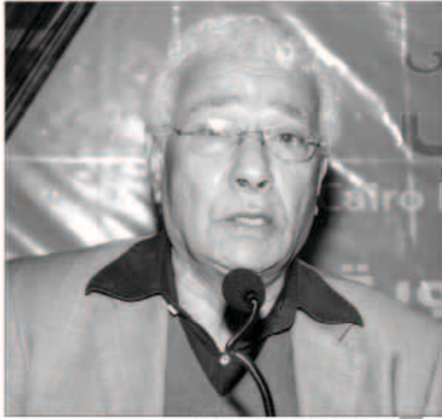
الكاتب والروائي المصري سعيد الكفراوي

الأسلوب وتحول إلى الأسلوب السريدي في رواياته الأخيرة. مكانة كبيرة من جهة قال الكاتب والروائي المصري سعيد الكفراوي في تصريح لوكالة الأنباء الكويتية «كونا» أن الأديب اسماعيل فهد