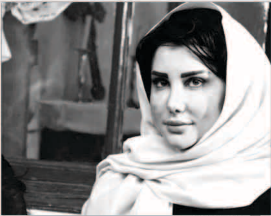
جينى إسبر بالحجاب

انضمت الفنانة السورية جينى إسبر إلى المسلسل الشامي الجديد «ابواب الريح»، حيث تجسد شخصية «هدية». جينى نشرت مجموعة من الصور من المسلسل على صفحاتها على مواقع التواصل الاجتماعي حيث تظهر فيها وهي تضع الحجاب. المسلسل سيشترك في الخريطة الرمضانية لعام 2014 ويشارك في بطولته مجموعة كبيرة من الممثلين من بينهم الممثل القدير غسان مسعود.