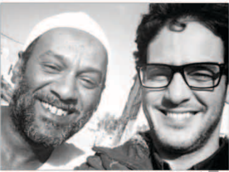
أبو النجا في كواليس «قدرات غير عادية»

قام الفنان المصري خالد أبو النجا، بنشر مجموعة من الصور من كواليس فيلمه الجديد «قدرات غير عادية»، والذي يشارك في بطولته. ويؤدي أبو النجا من خلال أحداث العمل شخصية «دكتور يحيى» وهو طبيب يعيش داخل البيسبون وتجمعه علاقة بـ «حياة» التي تؤدي دورها نجلاء بدر، والتي تقوم بدور صاحبة البيسبون، ولهذا قرر أبو النجا اختيار شكل مختلف للشخصية حتى تميزه عن الأدوار السابقة التي قام بها، حيث قام بارتداء نظارة طبية طوال الأحداث. فيلم «قدرات غير عادية»، يشارك في بطولته محمود الجندي، ونجلاء بدر، ومن إخراج داوود عبد السيد.