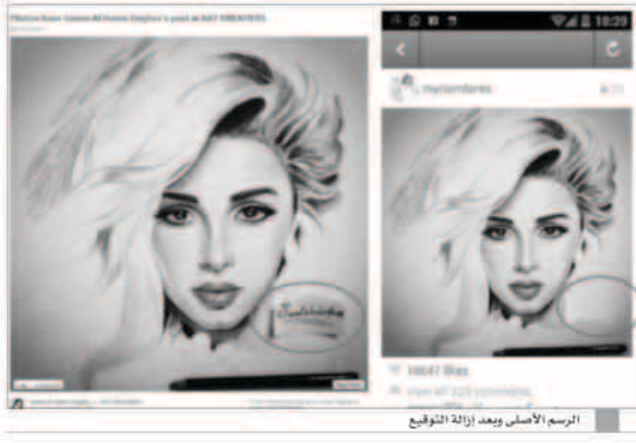
الرسم الأصلي وبعد إزالة التوقيع