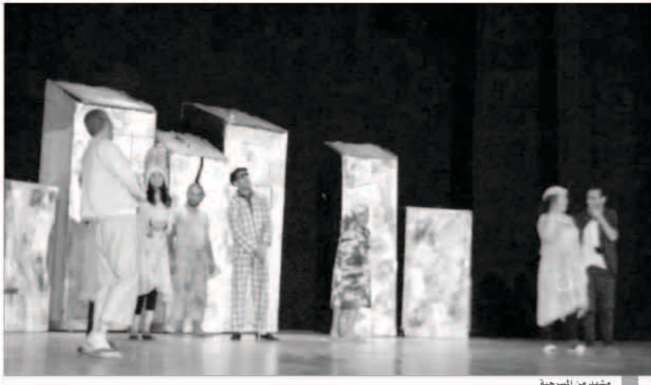
مشهد من المسرحية

البلدية والبرلمانية عبر مواقف واقعية بين أبناء الحي وأبناء العشيرة والأصدقاء وفيها نوع من الوعود الكاذبة لشراء أصوات الناخبين». وذكر ان المرشحين يسعون باي ثمن لكي يحصلوا على الأصوات من خلال اقناع المقربين منهم ببرامجهم السياسية ووضع امامهم مجموعة من الإغراءات والعروض التي ستخرجهم من «الغرق» حسب تعبيره. وأشار الى انه من بين كل المشكلات التي تبرزها المسرحية تظهر قصة حب بين الشاب هلال وجارته نجمة وهما يرمزان للراية الوطنية الجزائرية «النجمة والهلال». وأكد انه «بالرغم من كل المعاناة فان الحب ينجح في جمع الحبيين ويتزوجان في تحد للظروف الصعبة التي يعيشانها في ذلك الحي حيث تصور المسرحية صورة في غاية الجمال لانحصار الحب بين الركام وبيوت القصدير». واعتبر النقاد هنا ان المخرج تمكن من معالجة القضية بشكل جيد ومناسبة لثقافة المشاهد الجزائريين. وقال النقاد ان المسرحية تقدم صورة حقيقية للعشوائيات التي تعرف في «فوضى عارمة» باعتبار تلك العشوائيات «مسكن غير قانونية كما تصفها الجهات الرسمية». وأوضح ان المسرحية تقدم صورة مختلفة منها «شجارات الأزواج» بسبب سوء المعيشة في مثل هذه العشوائيات أو «الغيتوهات».