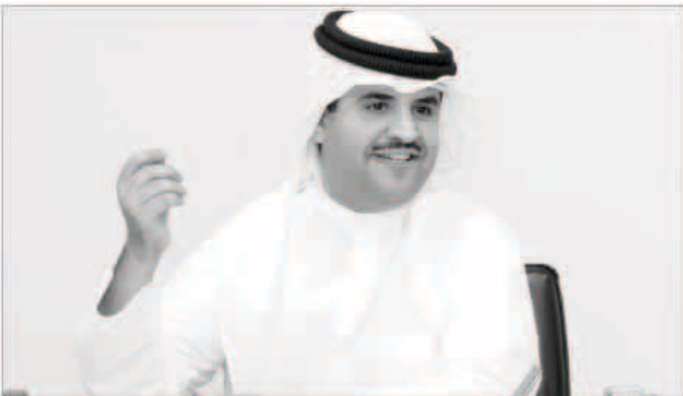
الشاعر الشيخ دعيج الخليفة