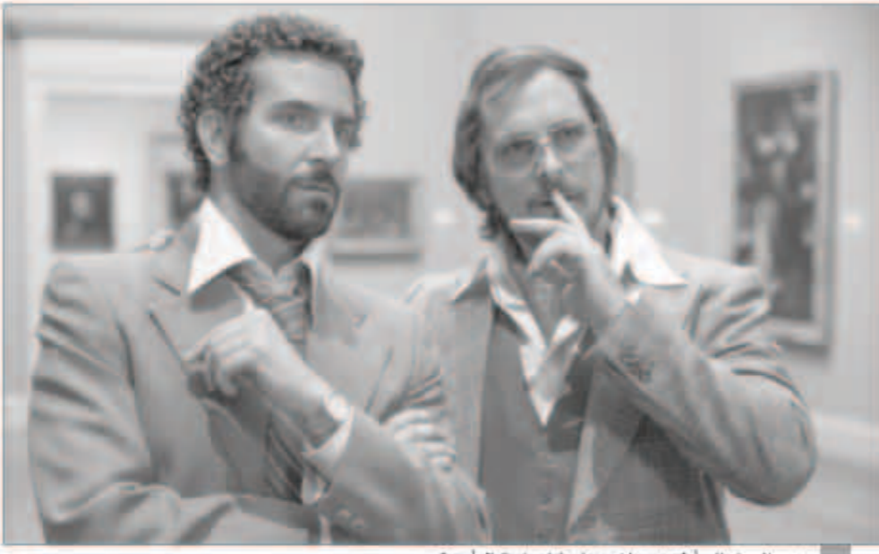
دبي السينمائي أول مهرجان يعرض فيلم «احتفال أمريكي»

جمعة: رؤيتنا دائماً منصبة على اختيار أفضل إنتاجات السينما العربية والعالمية