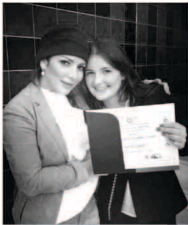
أصالة مع ابنتها في حفل تكريمها

كثيرة هي الأخطاء التي يقع فيها المشاهير على مواقع التواصل الاجتماعي، ومنها ما حدث مع الفنانة السورية أصالة حيث نشرت صورتين جديدتين لتوأمها آدم وعلي على حسابها الرسمي ولم تنتبه أن زوجها جالس خلف آدم وهو يرتدي «بيجامة نوم» كما أخطأت أصالة بتعليقها الإنجليزي على صفحاتها من ثم صححت غلطتها وكتبت: «غلطت اليوم غلطتني الأولى كتبت إنكليزي غلط وهاد متوقع مني ونزلت صورته لآدم ووراه تبتو بالبيجامة وقاعد براحتة بالبلبلون بدبي الرائعة. ولكن شامي بتني أنقذتني بحفل تكريمها وكان في ذلك ما يواسيني على قلة معرفتي بالإنكليزي وعدم تدقيقي بالصور التي يتسرع وينزلها. مبروك حيايبي صرنا أكبر صرنا اثنين مليون وعقبال ما تصير قد شعب الصنّ قولوا أمين».