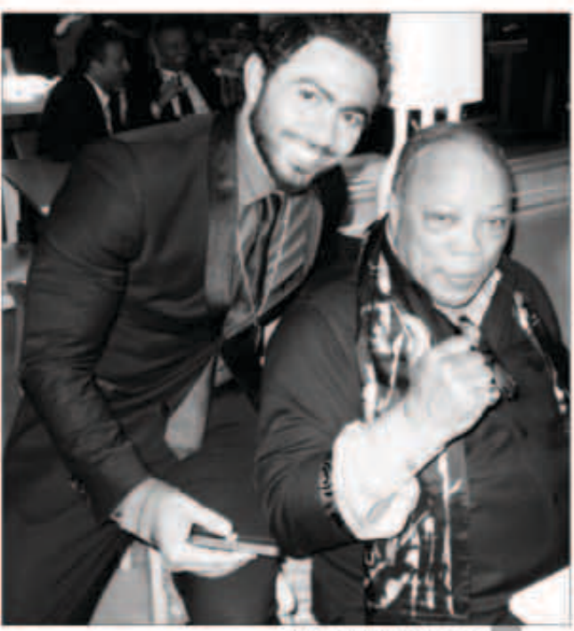
تامر حسني مع كوينس جونز

نشر الفنان المصري تامر حسني صورة له تجتمع بالمنتج الشهير كوينسي جونز مكتشف مايكل جاكسون على موقع تويتر وكتب أسفله «With the legendary producer Quincy Jones celebrating his birthday with me».