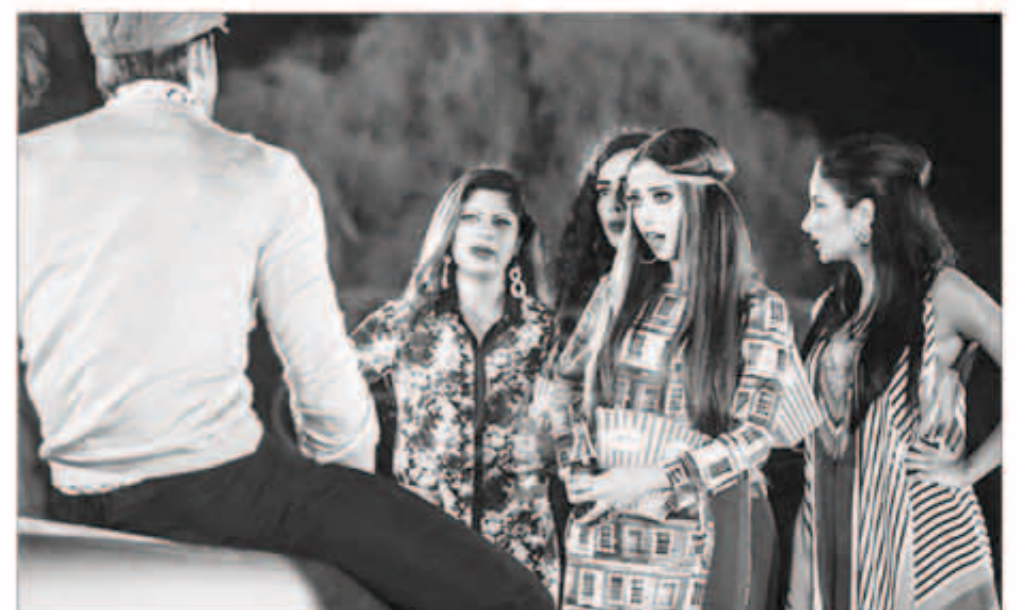
بليقيس في كليباتها «رد قلبي»

تخلت المطربة اليمنية بليقيس فتحي عن الموضة والإطلالات المعاصرة، لتظهر في أحدث كليباتها «رد قلبي» بإطلالة من السبعينات.