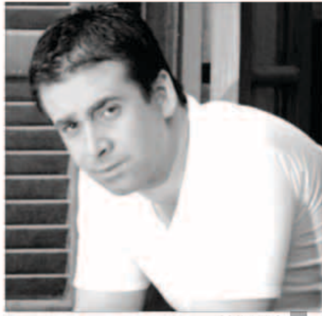
كريم عبد العزيز

للشركة المنتجة عقب وضع اللمسات النهائية على العمل والذي أوشك على الانتهاء منها، استعدادا لعرضه خلال موسم عيد الأضحى المقبل.