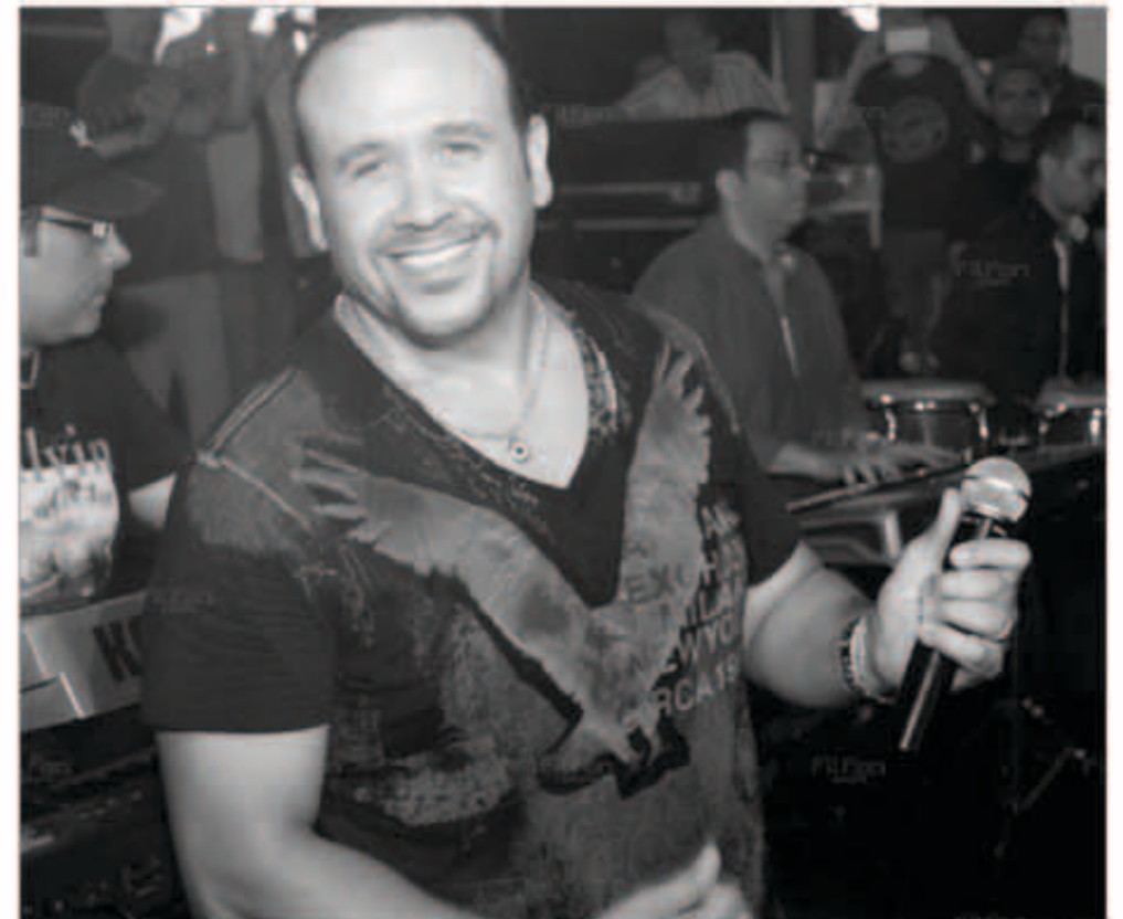
هشام في بورتو مارينا