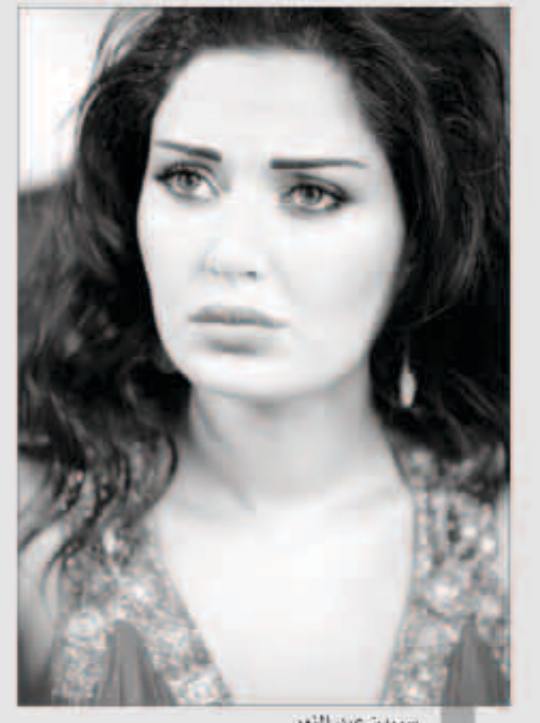
سيرين عبد النور