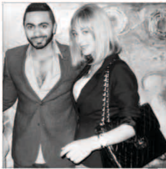
بسمة مع زوجها تامر حسني

لجات الفنانة المغربية العزتلة وزوج الفنان المصري تامر حسني بسمة بوسيل إلى تغيير اللوك الخاص بها بعد إنجاب ابنتها «تاليا».