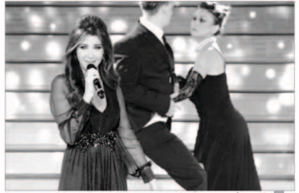
نانسي عجرم ألهمت المسرح حماساً