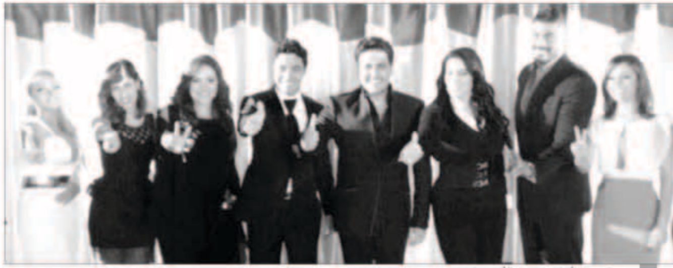
سمية الخشاب أثناء مشاركتها في أوبريت ثورة شعب

فاجت الفنانة المصرية سمية الخشاب جمهورها بعد أن فقدت الكثير من وزنها لتستعيد شأقتها مجدداً أثناء مشاركتها في تصوير أوبريت «ثورة شعب».