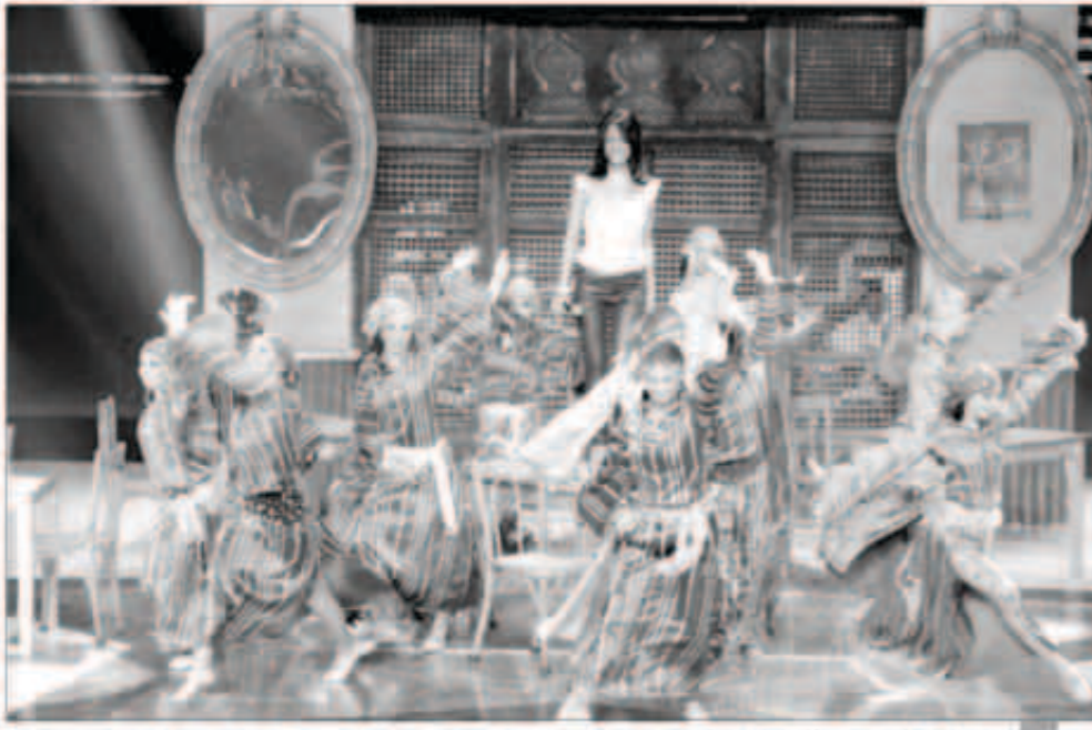
البرنامج ظهر شديد الإقبال بعد توقف عامين