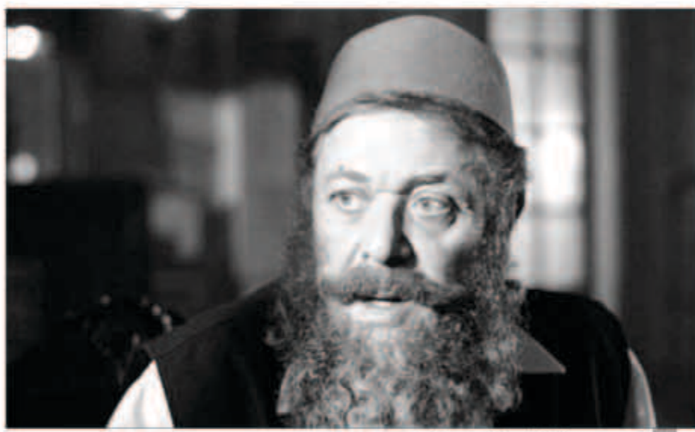
محمود عبد العزيز في مسلسل «باب الخلق»

سيبدأ تصويره في شهر ديسمبر محمود عبد العزيز يعود بـ «جبل الحلال» في رمضان المقبل