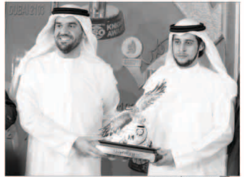
الجسمي مكرماً بدرع «أم الدنيا»

الأولى في تاريخ المهرجان بحصول فنان على هذا التكريم عامين متتاليين، بناءً على ما صرح به مدير المهرجان المهندس طارق حمدان. هذا وقد أقيم مهرجان فرسان الجودة في دورته الحادية عشرة في مدينة دبي في فندق البستان روتانا، الذي يعقد سنوياً بمناسبة الاحتفالية الدولية لليوم العالمي للجودة، برعاية منظمة الأيزو العالمية والأمم المتحدة، حيث قام بالمشاركة في عملية التكريم الشيخ حمدان بن خليفة بن سلطان آل نهيان، وبحضور أهل الصحافة والإعلام الإماراتية والعربية. كما أوضحت إدارة مهرجان فرسان الجودة، أن اللجنة