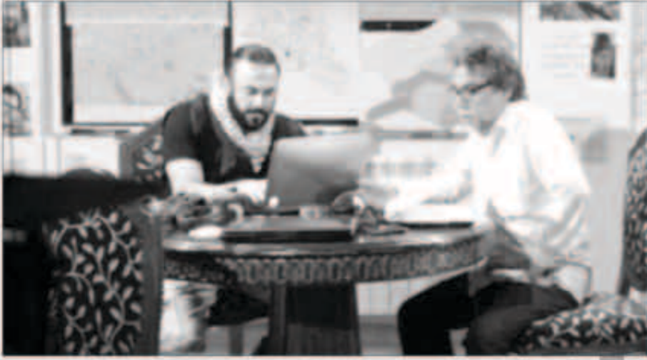
مشهد من العمل