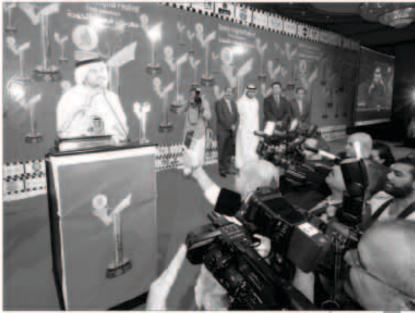
...ومتحدثاً لوسائل الإعلام