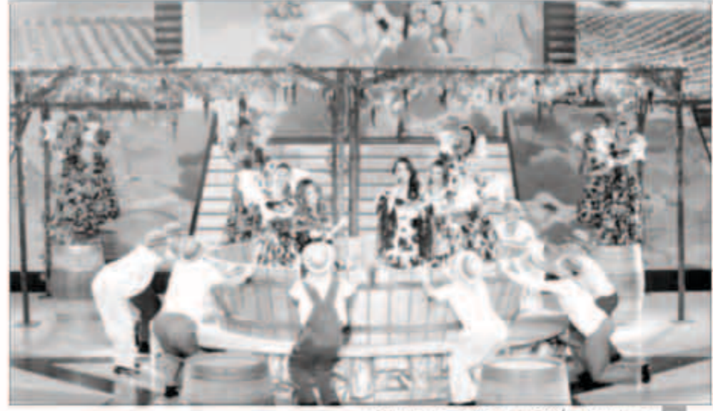
ميساء و زينب بأغنية «على دعونا» وسط عرض الغناء

قبل بدء حلقة برنامج «ستار أكاديمي» بدقائق، علقت الفنانة هيفاء وهي يذريا من الكريستال في سقف ستوديو «بلاتيا» في بيروت، وافتتحت البراميم الثالث بأغنية منفردة، لتثير موجة من الحماس على عكس البراميم الماضية. وبدأ واضحا استعداد «ستار أكاديمي» وهجه في هذه الحلقة، حيث نجحت هيفاء في أن تجذب الإضواء، عبر ثلاث إطلالات سحرت الحضور، ونجحت في إشعال جو الحفل، وسط حضور عدد كبير من جمهورها.