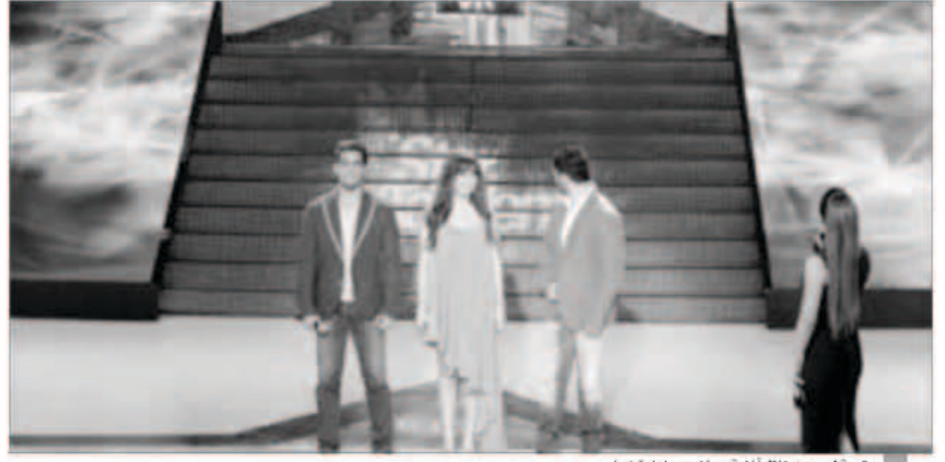
تحية لمصر من خلال أغنية «بحلف بسماها وترابها»