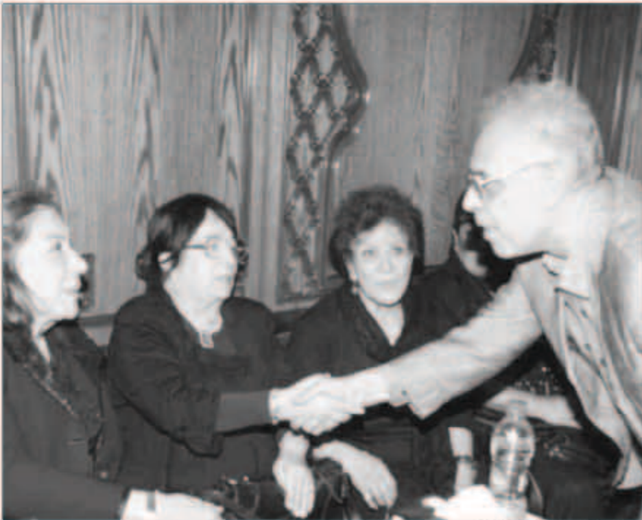
الفنان نبيل الحلقاوي

حضرُوا على مواساتها منهم محمود الحديتي وسامح يسرى، والمخرج المسرحي خالد جلال، ورجاء الجداوى، و ميرفت أمين، ونبيل الحلقاوي وعزت العلابي وهاني رمزي ونقيب الممثلين أشرف عبد الغفور، وسهير المرشدي، ومحمود ياسين.