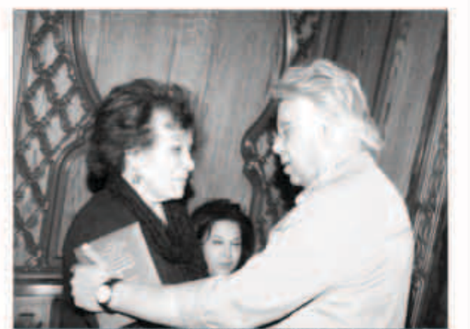
الفنان اشرف عبد الغفور معزى الفنانة عابدة عبد العزيز