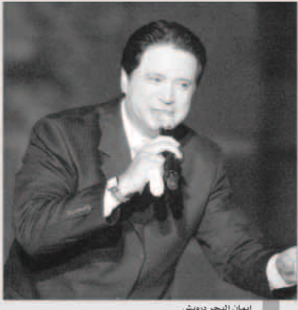
إيمان البحر درويش

أكد الفنان إيمان البحر درويش لـ «اليوم السابع»، أنه استقر على مطلع يناير المقبل، ليكون موعداً لألبومه الغنائي الجديد «مش ندمان»، والذي يعود من خلاله للساحة الغنائية، موضحاً أن جميع أغاني الألبوم رومانسية، ويتعاون من خلاله مع عدد كبير من الشعراء والمحنين منهم عوض بدوي، ومصطفى درويش، وأحمد عبدالعزيز، ووليد سعد، ومن الموزعين يحيى الموجي، ومحمد العشري، وحازم رافت.