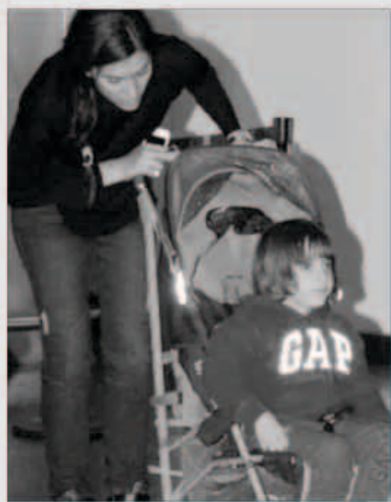
بيرغوزار كوريل مع علي

امضى الزوجان خالد ارغتش وزوجته بيرغوزار كوريل عطلة عيد الأضحى في لندن برفقة ابنتهما علي، وقد شوهدا أخيراً في مطار «أتاتورك» التركي عائدين من عاصمة الضيافة. وكانت بيرغوزار تجر عربة ابنتها في حين كان «السلطان» يهتم بالحقائب. واللافت أن حذاء زوجة السلطان الرياضي «كونفيرس» أثار انتباه الصحافة التركية التي اعتبرت أن بيرغوزار من المتابعات الشغوفات بالموضة، لذلك اختارت الـ «كونفيرس» كونه موضة رائجة كثيراً في تركيا.