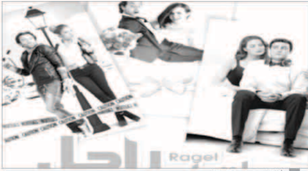
أفلام العيد هربت من القرصنة

عانت الأفلام السينمائية طيلة السنوات الماضية من ظاهرة تسريبها على مواقع الإنترنت خصوصاً في مواسم الأعياد، وهو ما كان يؤثر تأثيراً شديداً على إيرادات الأفلام كل موسم، إلا أن هذا الموسم يعد موسماً مختلفاً، فلم يتم تسريب أي من أفلام العيد وهي «القشاش» و«عش البلبل» و«8 في المئة» و«هاتولي راجل». ويبدو أن الأوضاع السياسية التي تمر بها البلاد في الفترة الحالية جعلت جمهور السينما يقل تدريجياً وهو ما أثر على القرصنة التي اختلف هذا الموسم تماماً، كما أن شركات الإنتاج السينمائية تحاول جاهدة محاربة سرقة الأفلام من خلال حرب إلكترونية مع القرصنة، حيث تعاقدت شركات الإنتاج مع شركات خاصة لمحاربة القرصنة والقضاء على أي روابط لتحميل أو مشاهدة الأفلام من خلال الإنترنت، ومن الشركات التي حاولت جاهدة القضاء على القرصنة «السيكي» لحماية فيلمه «عش البلبل» و«دولار فيلم» وغيرها من الشركات التي تعرض لها أفلام حالياً بدور العرض. ويدرس حالياً العديد من المنتجين كيفية مواجهة الخطر الإلكتروني الذي ظهر مؤخراً في العامين الأخيرين ويتعلق بوجود قنوات فضائية مجهولة تعرض أفلاماً بدون وجه حق وبدون أن تشتري حق عرضها من شركات الإنتاج ولكن من خلال القرصنة عليها وهو ما يتسبب في خسائر أكبر للشركات ولا سيما أن التحكم في هذه القنوات بات صعباً وذلك لخروجها من أعمار أخرى غير النابلسات، حيث تعرض هذه القنوات أفلاماً جديدة بمجرد طرحها على مواقع الإنترنت.