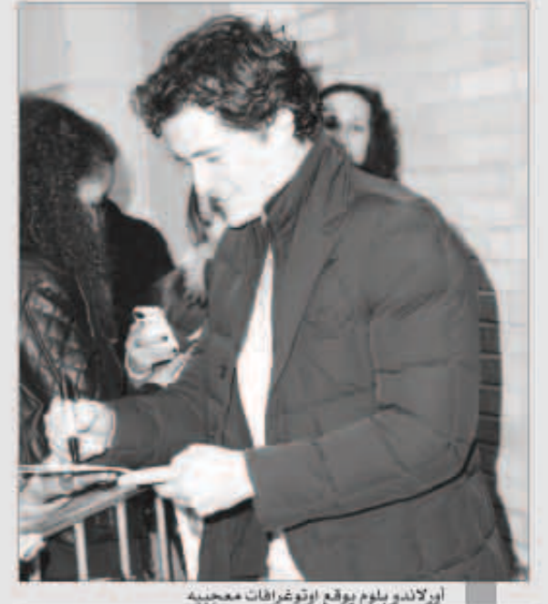
أورلاندو بلوم يوقع أوتوغرافات معجبيه

الممثل البالغ من العمر 36 عاماً التقى بجمهوره الذي انتظره في الخارج، والتقط الصور مع معجبيه كما وقع لهم.