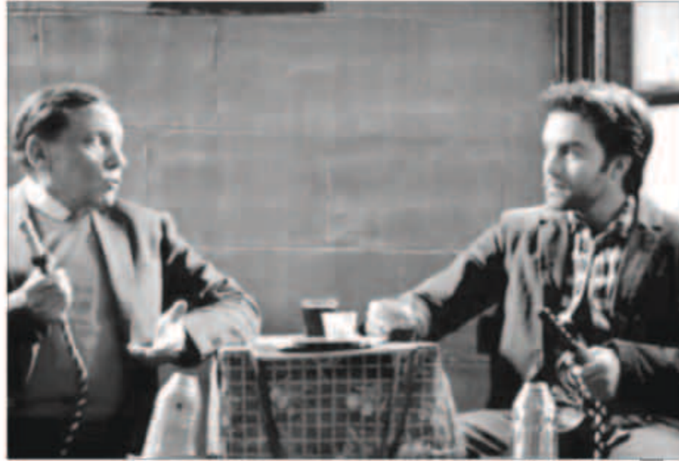
... ومع الزعيم في العراف