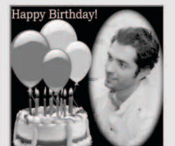
محبو الفنان محمد باش تهنئوا بـ معايدته

احتفل الفنان السوري محمد باش بعيد ميلاده وسط تهنئات وصور مميزة أرسلها له محبوه عبر جميع حساباته الرسمية على مواقع التواصل الاجتماعي، وهي المعايدات التي نشرها محمد وشكرهم عليها. المفاجأة كان نجاح فنان نجم ستار أكاديمي في عمل هاشتاغ لمعايدة باش في عيد ميلاده، دخل في الترتيب العالمي على موقع يوتيوب، الأمر الذي أسعد محمد كثيراً. محمد باش أعرب عن سعته بالتحفال محبيه بعيد ميلاده، وكتب: «كثير ميسوط فيكون وبمعايداتكم بيوم عيدي بوجودكن معي صار للحياة معنى أجلي».