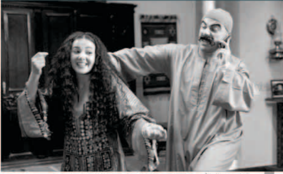
.. وفي مشهد من «الكبير أوي»

لم أفكر في تقديم برامج تليفزيونية وعرض علي الأمر كثيرا وأنا رفضت