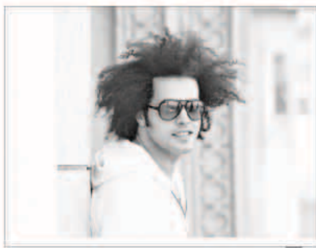
عبد الفتاح الجريني

كشف الفنان المغربي عبد الفتاح الجريني أنه رفض المشاركة في برنامج اكتشاف المواهب الغنائية «The Winner is» لأنه لا يملك الخبرة الكافية التي تؤهله للجلوس على أحد مقاعد لجنة التحكيم ليقيم المواهب الغنائية خصوصاً أن رصيده الفني 3 ألبومات في غضون 5 أعوام. وقال الجريني في مقابلة مع مجلة «لها»: «اعتقد أن خطوة المشاركة في برنامج اكتشاف المواهب الغنائية غير مناسبة لي في الفترة الحالية لكن مستقبلاً وبعد اكتساب الخبرات اللازمة في الغناء لن أمانع المشاركة فيها».