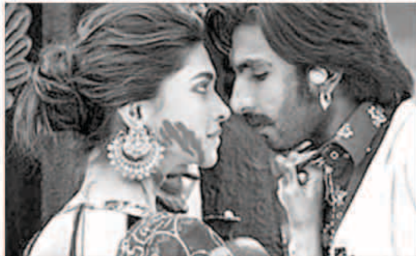
«رام ليلا» يفتتح مراكش السينمائي

تم اختيار الفيلم الهندي الجديد، «رام ليلا» ليكون فيلم حفل افتتاح مهرجان مراكش السينمائي الدولي، في دورته الـ13، والتي تقام في الفترة من 29 نوفمبر، إلى 7 ديسمبر المقبل، وهو فيلم للمخرج سانجاي ليلا بانسالي، صاحب فيلم «ديفداس»، وسيكون ذلك بحضور مخرج الفيلم والممثلة ديبিকা بادوكون. بطولة الفيلم، يذكر أن دورة هذا العام سراسر لجنة تحكيمها المخرج العالمي مارتن سكورسيزي.