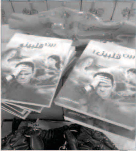
غلاف رواية «بين قلبين»