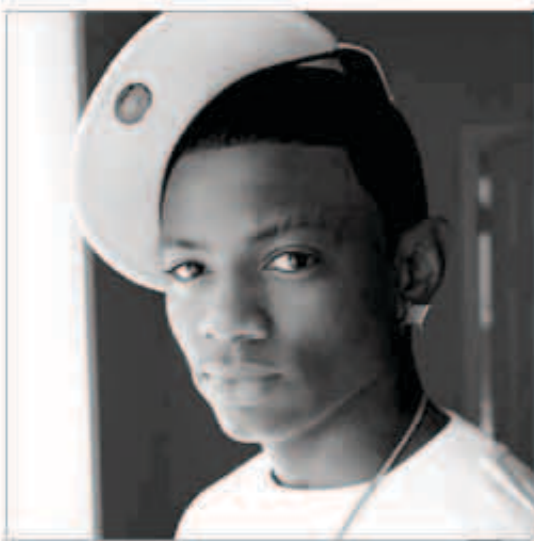
صوفيا جريس بوي