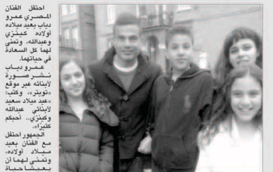
عمرو دياب مع أولاده

احتفل الفنان المصري عمرو دياب بعيد ميلاده الأولاد كينزي وعبدالله، وتمني لهما كل السعادة في حياتهما.