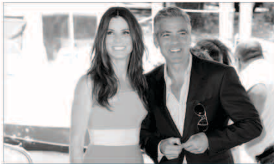
جورج كلوني وساندرا بولوك

يبدو أن تأكيد النجمة سانرا بولوك على أنها ليست من النساء المعجبات بالنجم جورج كلوني، قد أثار غضب الأخير، لذا قرر السخرية منها وفضحها رداً على تصريحها.