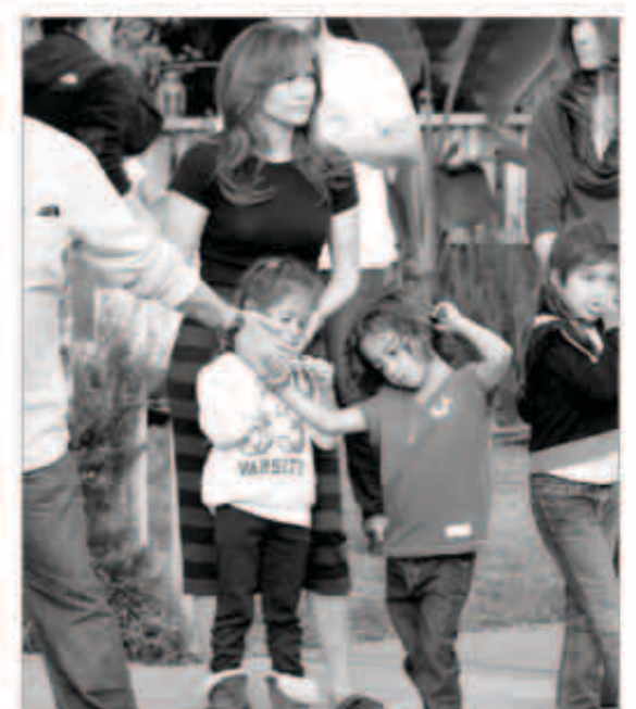
لوبيز بصحبة طفلها

التقت عدسات المصورين لقطات للنجمة العالمية جينيفر لوبيز، أثناء تصويرها مشاهدتها بفيلمها الجديد، وكانت لوبيز مصحبة طفلها التوام ماكس وإيمي، والذنان يظهران معها طوال الوقت حتى أثناء عملها. وعلى الرغم من انشغال لوبيز بالتصوير، إلا أنها كانت تغير أظفارها الكثير من الاهتمام طوال الوقت، هذا حسبما ذكر موقع جريدة الديلي ميل البريطانية.