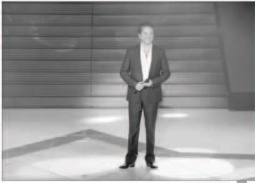
النجم مروان خوري