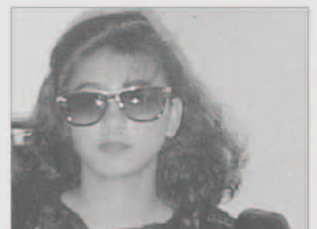
هيفاء حسين في سن المراهقة

هيفاء نشرت صورة لها وهي ترتدي فستان سهرة باللون الأسود، مطعم بالفصوص الفضية وغطت عينها بالنظارة الشمسية، وغربت قائلة: «صباح الدلع والصور التذكارية». كان عمري 14 سنة... والله أيام».