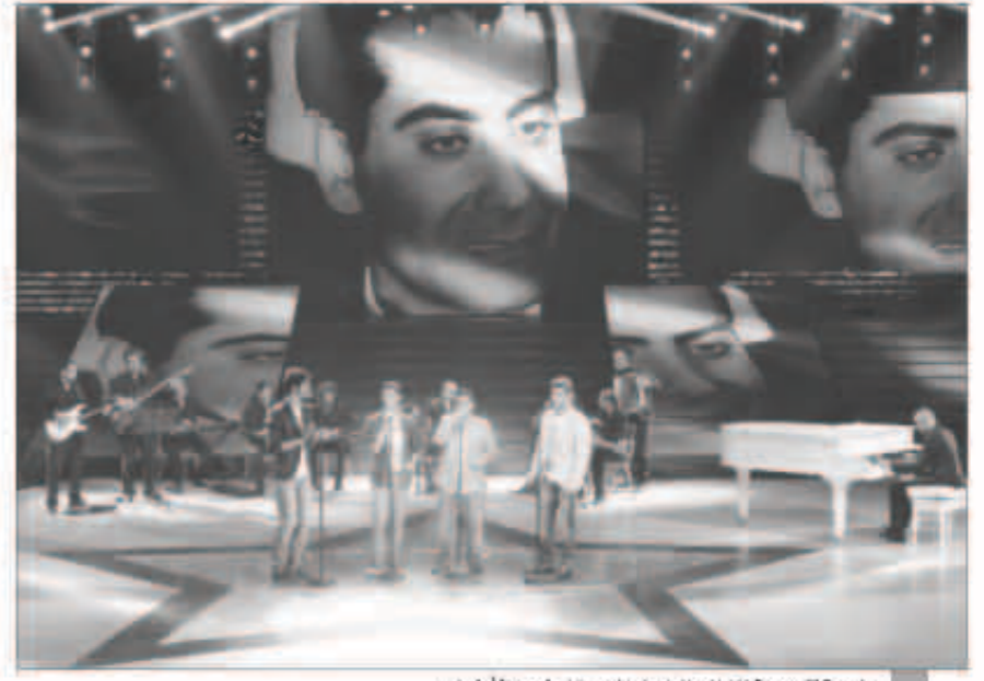
لوحة تكريمية للشاعر الراحل الموسيقار فريد الأطرش