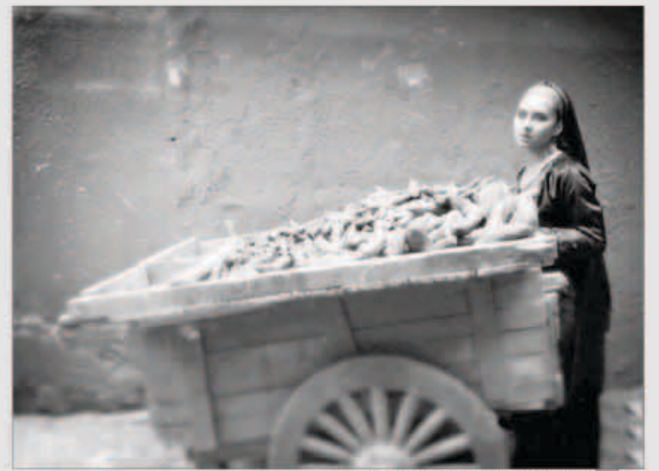
نيلاي كريم بائعة بطاطا في فيلمها الجديد

بعد النجاح الكبير الذي حققه مسلسلها الأخير «ذات»، تستعد الفنانة المصرية نيلاي كريم لفيلم جديد بعنوان «يوم للسبات».