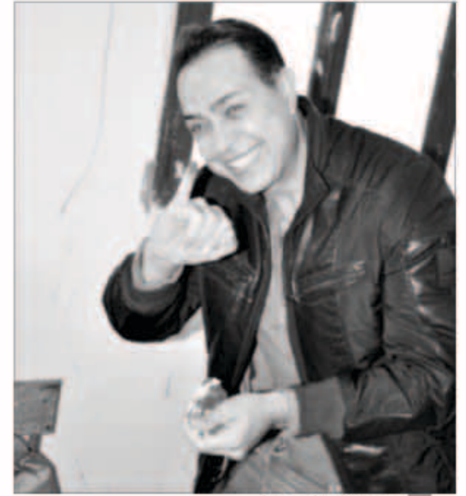
حكيم أثناء الإدلاء بصوته

«إيلاف»: باستثناء الفنان خالد أبو النجا الذي أعلن عن رفضه مشروع الدستور الجديد، خرج عدد كبير من الفنانين المصريين للإدلاء بأصواتهم على مشروع الدستور المعدل، وحرصوا على تشجيع المواطنين ودفعهم للمشاركة بالإستفتاء وتأييد الدستور الجديد.