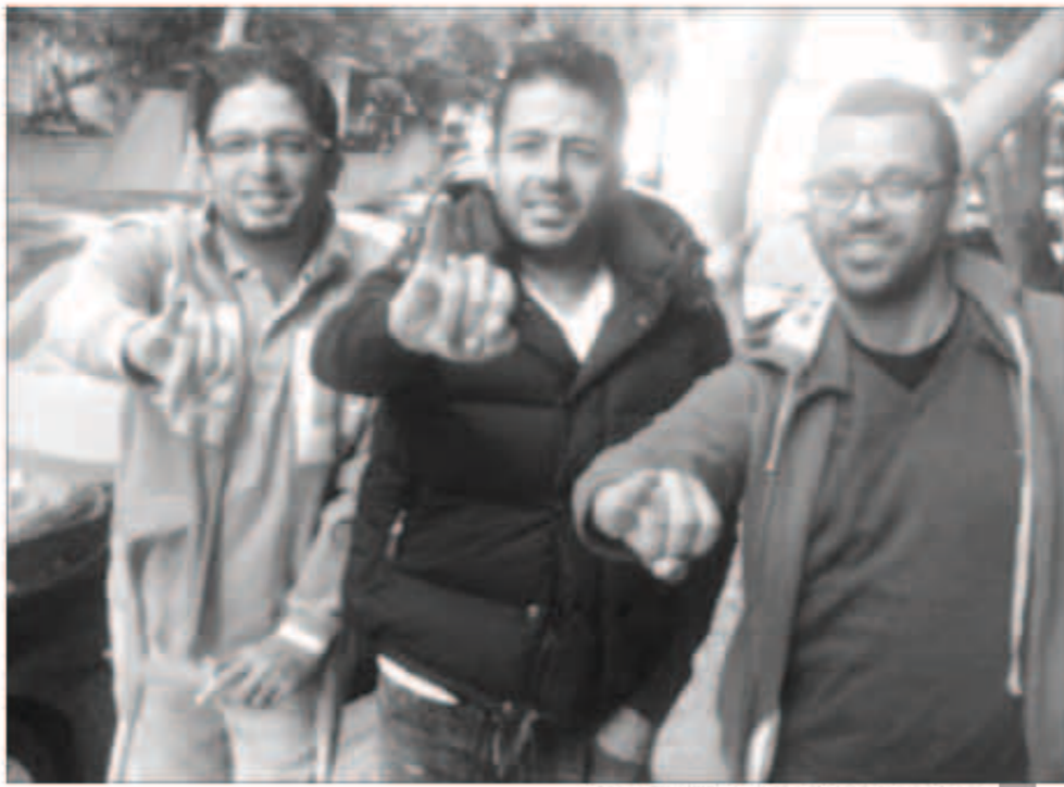
حماتي بصورة تذكارية مع شقيقه بعد تصويتها