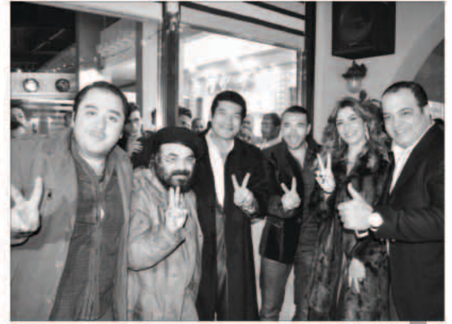
نجوم الفن الحاضرين

استمر بعد ذلك إعلان كل من أحمد علاء ولفاء سويدان انطلاق المهرجان رسمياً وبدأت فقرات الحفل تتوالى مع عزف كمان ومطربة وعازفة روسية وفقرة للمطربتين سوسكا وريهام حلمي وكانت آخر فقرات الحفل مع الفنان نادر أبو الليف الذي ألهم مارينا الغردقة وتفاعل معه الجمهور بشكل رائع.