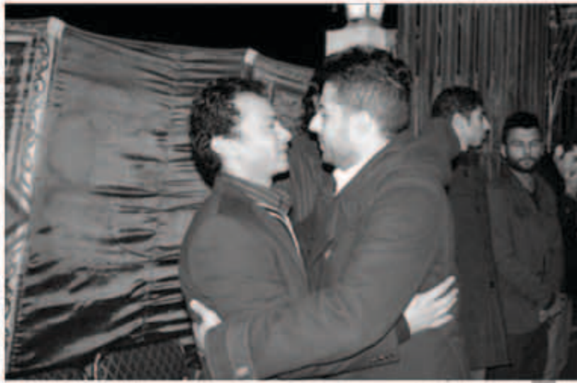
حماتي معزياً محي