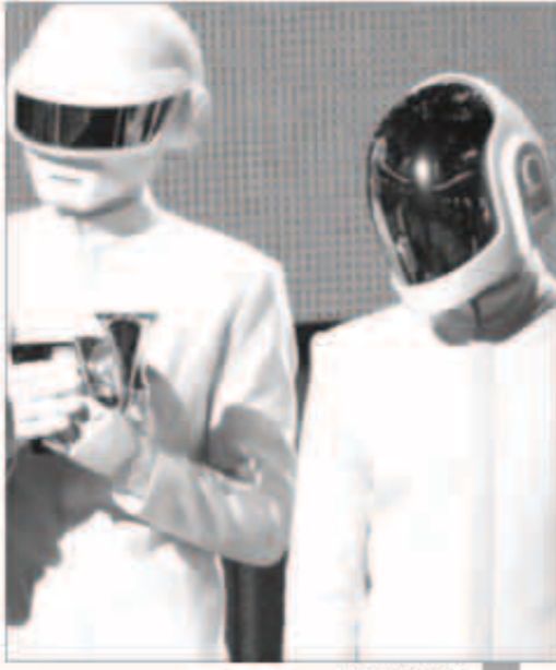
فرقة دافت بنك