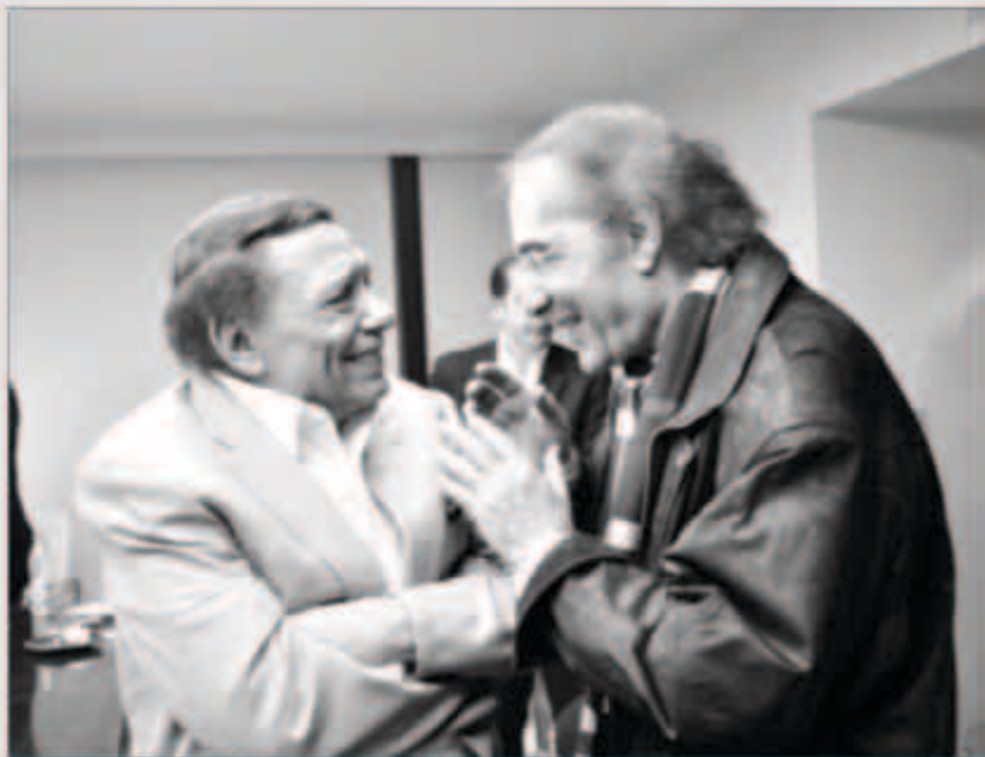
محمود ياسين مع عادل إمام

أحداث دقيقة وصعبة في تاريخ مصر، وتابع: «لكن للأسف الشديد، ظهر خلاف في وجهات النظر مع السادة القائمين على العمل حول كيفية سير العملية التصويرية للمسلسل، وقد حاولنا كاسرة عمل اجتياز هذا الخلاف أو بالأحرى معالجته، لكننا لم نوفق، وبناء عليه، تم التوافق على فسخ العقد البرم بيننا بالتراضي مع خالص الاحترام والتقدير وأمنيات النجاح والتوفيق لأسرة مسلسل «صاحب السعادة»». يذكر أن محمود ياسين غضب بشدة من عادل إمام بعدما تردد أنه استعده من المسلسل، خصوصاً أنه صور عدداً من المشاهد التي تجعده به.