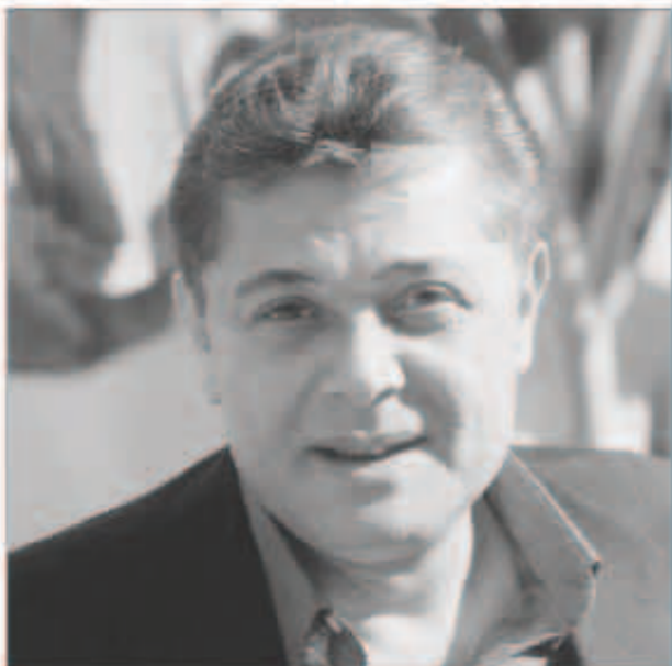
محمود عبد العزيز