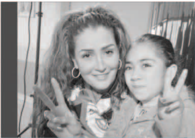
... ومع إحدى أطفال المستشفى