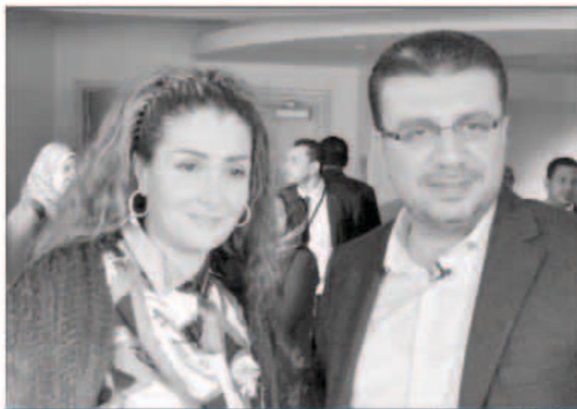
غادة وعمرو الليثي

تجسد شخصية مدرسة في الأربعين تربطها علاقة عاطفية بطالب في عمر الـ16. ولغفت إلى أنها تذهب دائماً لأداء العزرة بالنقاب حتى لا يتعرف إليها أحد، مؤكدة أنها تفضل أن تكون على راحتها في هذا المكان.