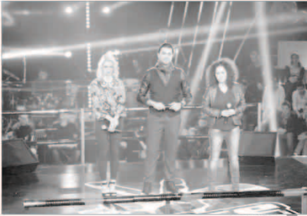
من مواجهات الحلقة