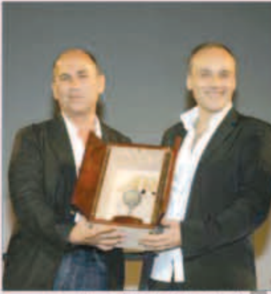
المخرج إبراهيم البطوط يستلم إحدى جوائز

وكان «قصة ثواني» عرض في 3 تشرين الأول الجاري في افتتاح الدورة الثانية عشرة من مهرجان بيروت الدولي للسينما. ويتناول قضايا اجتماعية في المجتمع اللبناني، في إطار قصة ثلاث شخصيات في بيروت، دو منها الأخرى، وتؤثر قرارات كل منها، من حيث لا تدري، في حياة الشخصيات الأخرى.