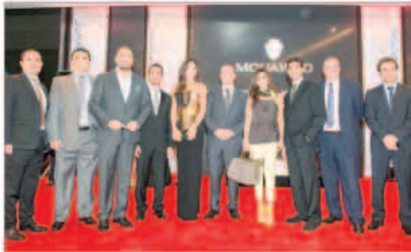
الحضور مع رامي عياش ونجوى كرم