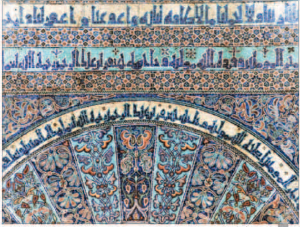
إحدى لوحات المعرض