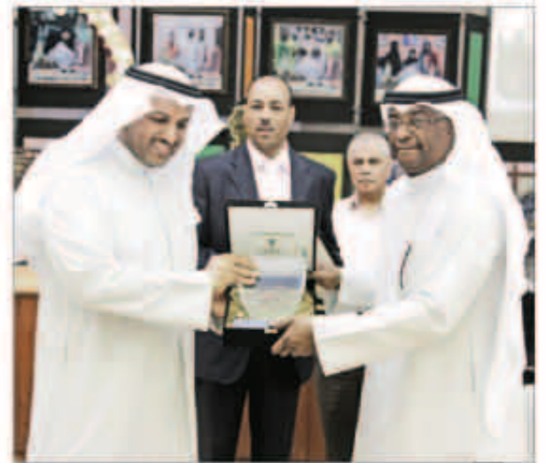
تكريم أحد المعلمين