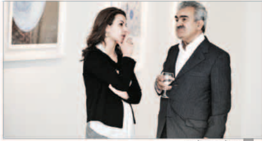
ومع أحد رجال الأعمال