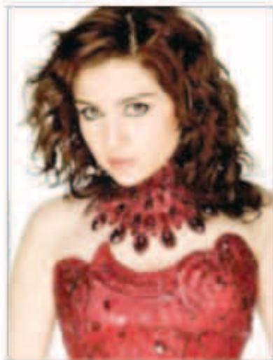
مي عز الدين

فاجأت مي عز الدين جمهورها بخبر ارتباطها مع لاعب الكرة الشهير محمد زيدان، وكانت قصة الحب قد بدأت بعد صداقة ربطت بينهما، وتحسن الجمهور لهذه العلاقة كثيرا وسط فرحة شديدة واحتفلات مي بخطوبتها على زيدان مع والدتها في جو بسيط. ولكن فوجئ الجمهور بخبر الانفصال الذي أعقبه إعلان زيدان عن عودته لحبيبته وزوجته حاليا، لتنتهي قصة الحب التي عاش معها الجمهور وتفاعل لسعادتها.