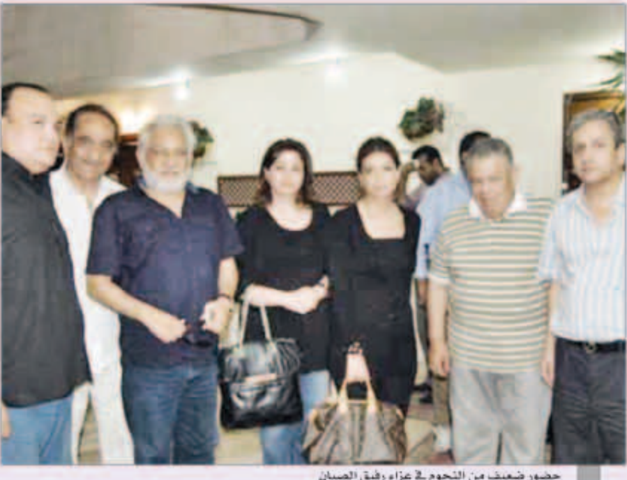
حضور ضعيف من النجوم بعزاء رفيق الصبان

قصة حب كبيرة جمعت بين ليلي علوي وفاروق الفيشاوي في الثمانينات خصوصا بعد أن جمعت بينهما العديد من الأعمال، وكان الفيشاوي تقدم بالفعل لخطوبتها