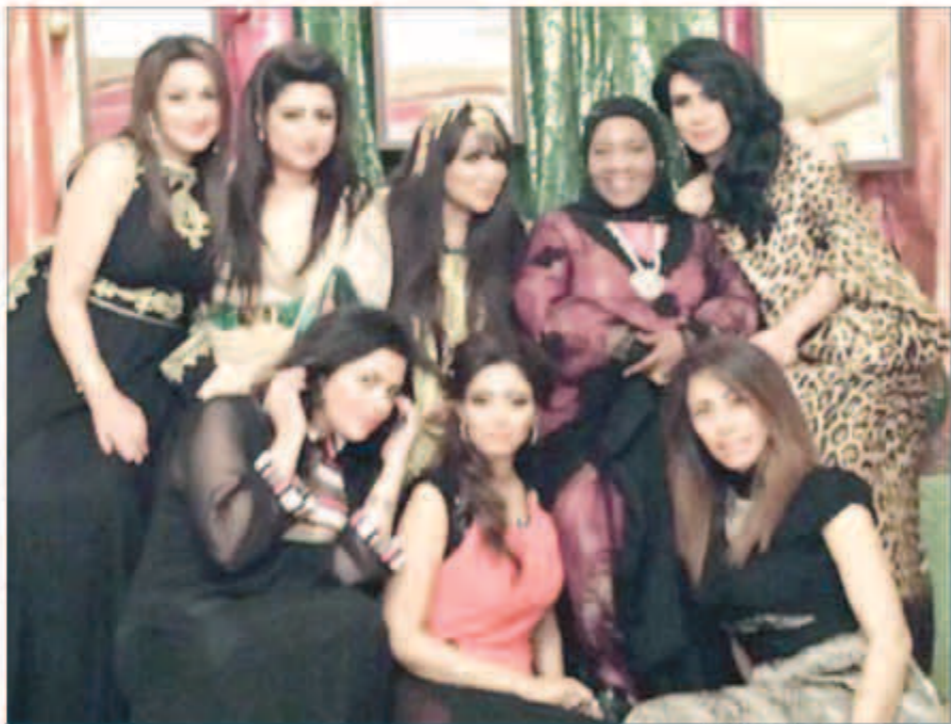
.. تتوسط أصدقائها

حل المؤلف الموسيقي إلياس الرجباني ضيفاً على برنامج «لازم نلتقي»، حيث قال عن ثقته على الفن واستغلاله من قبل البعض قال أنه يشن اليوم ثورة لإنقاذ للتلفزيون وحرباً ضد فنانين اليوم الأثرياء الذين يملكون ثروات طائلة عوضاً عن أصوات جميلة وصفهم بأنهم أقوى من الدولة، ففضل هذه الثروات يجتاحون عقولنا وأذواقنا وسمعتنا، والنخيل اليوم من بغني بلهجة ضيعته، وعلى صعيد آخر أعرب عن حزنه تجاه جمال المرأة اللبنانية وتطرق إلى موضة الحواجب العريضة، حيث توجه إلى ممثلة لبنانية وهي نجمة ومحبوبة كانت تقوم بعمل درامي في شهر رمضان وشبه حواجبها بالرئيس الراحل الشهيد رفيق الحريري، وأضاف أن رجال اليوم يملكون من الأثونة أكثر من النساء.