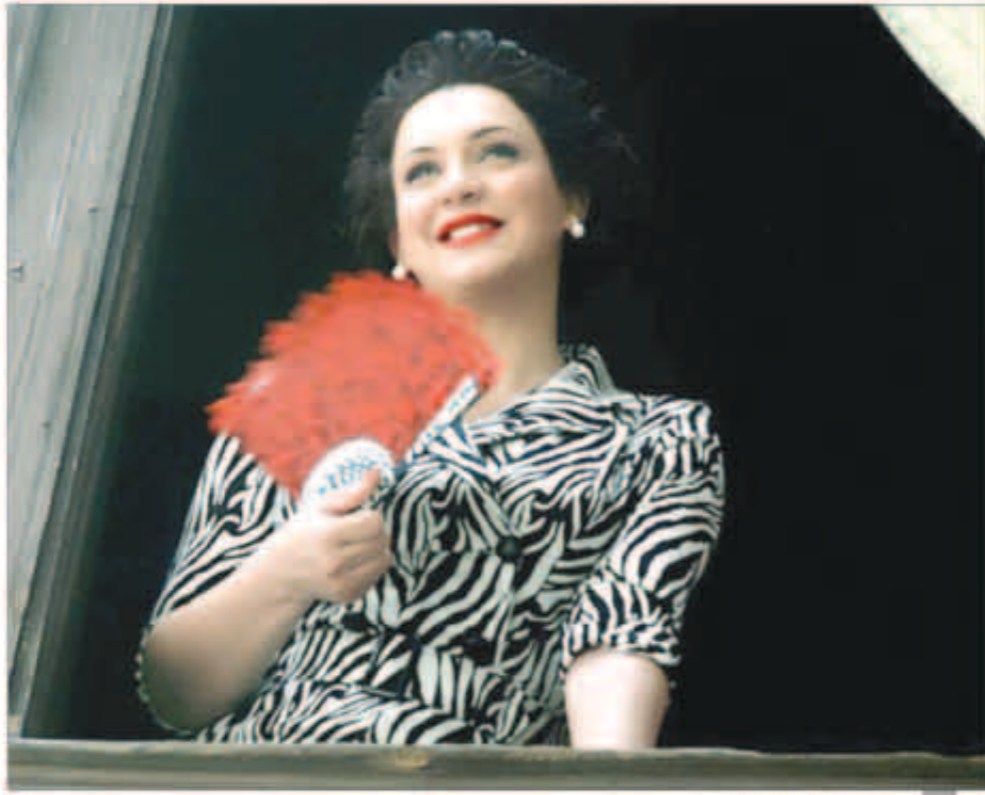
جميلة الدراما السورية