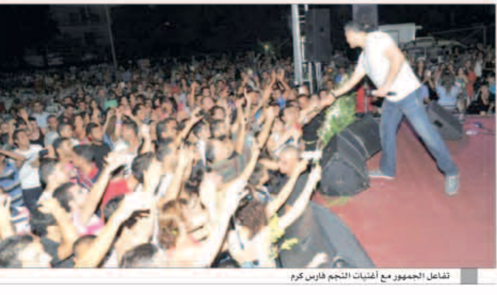
تفاعل الجمهور مع أغانيات النجم فارس كرم

ولو لم يكن فيها شيء جديد، لما أقدمت على غنائها في البومبي الأخير الذي طرح في الإيسواك، وحقيقة أرى في أعمال الفنان طارق محمد في كل مرة رؤية جديدة، وحلماً موسيقياً رائعة، ولديها قدرة في توصيل العمل اللحنية لدى المستمع بطريقة احترافية، وهذا ما يجعلني حريصة على التعامل معه بصفة مستمرة. وأكدت نوال إنها حريصة جدا على التعاون المستمر بينها وبين الشاعر السعودي علي وعين مشاركتها في الموسم الثاني من برنامج «أراب آيدول» قالت: سعيدة جداً بمشاركتي في هذا البرنامج السانج، وسعيدة أكثر بمشارع أخرى وزميلتي الفنانة الإماراتية أحلام والغنائية اللبنانية نانسي، وأتمنى من كل قلبي أن أكون قدمت وصلة مميزة نالت على استحسان الجمهور. وعن علاقتها بالفنانة أحلام قالت: أحلام «أم فهد» اخت وصديقة وتربطنا علاقة قوية جداً، وأكبر لها كل المحبة والاحترام.