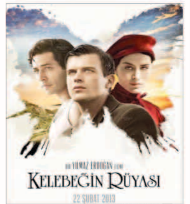
بوستر فيلم «حلم الفراشة»

يدخل الفيلم التركي «حلم الفراشة» للفنان كيفانش تاتليتوج والمعروف في الوطن العربي باسم «مهند» قائمة ترشيحات جوائز الأوسكار بدورته الـ 86 في فئة أفضل فيلم اجنبي. وكتب وزير الثقافة التركي على حسابه الشخصي بموقع «Twitter»: «فيلم حلم الفراشة سينال تركيا في حفل جوائز الأوسكار بالدورة الـ 86، حسب ما ذكره موقع «Haberturk» التركي. وتدور أحداث الفيلم حول شابان يقعان في حب فتاة ويترامنا علي كسب قلبها، ويتباريا في كتابة أجمل قصيدة لها، ولكن بعد مرور وقت يصاب أحدهما بالسل ويجزن صديقه عليه ويقرر أن يخسر الرهان من أجل صديقه المهرد بالموت. الفيلم من بطولة كيفانش تاتليتوج الشهير بمهند وفرح زينب عبد الله الشهيرة بـ أيلين في مسلسل علي مر الزمان، وعرض في دور العرض العربية شهر مارس الماضي تحت عنوان «حبيبتني».